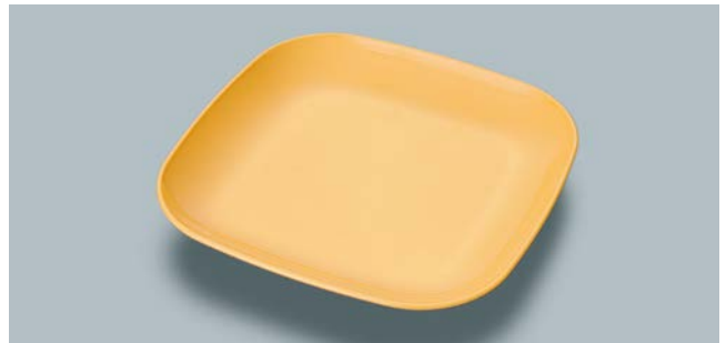
MS-844 MO(メロンオレンジ) フリープレート AB 230 × 230 × 30 ¥1,670 W-2323 ¥430 → P.307