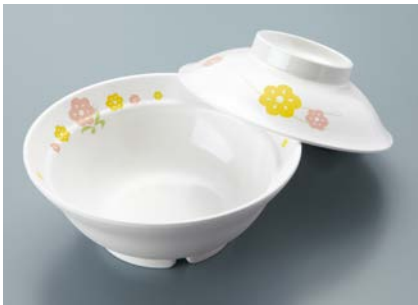
MB-607 KAK(かくれんぼ) 煮物椀蓋