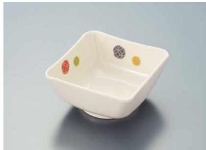
MB-686 EMED(江戸小紋)四角小鉢 AB 89 × 89 × 44 ・ 180ml ¥850 C-1010 ¥320 → P.306