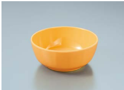
MB-647 MO(メロンオレンジ) 丸小鉢 110 × 45 ・ 270ml ¥560