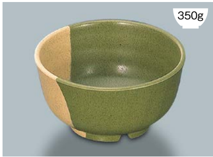
MB-593 WM (技) 多用丼 AB 150 × 78 ・ 780ml ¥1,070 P-202 ¥380 → P.303 P-207 ¥420 → P.303 71S ¥860 → P.308