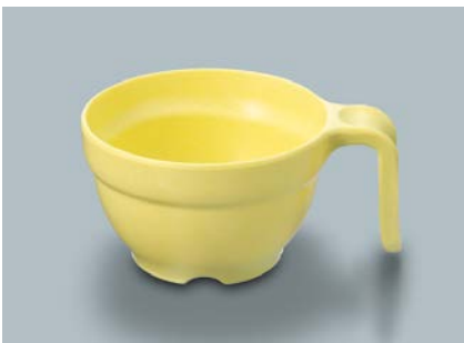
MC-80 NAN (菜の花) スープカップ AB