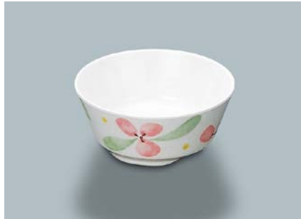
MB-50 FA(ふる里)小鉢 AB