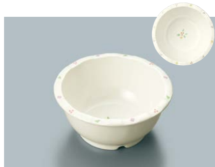
▲ MB-333 HMR(華かんむり) 丸小鉢 116 × 53 ・ 280ml ¥990 ☞ C-110 ¥330 → P.303