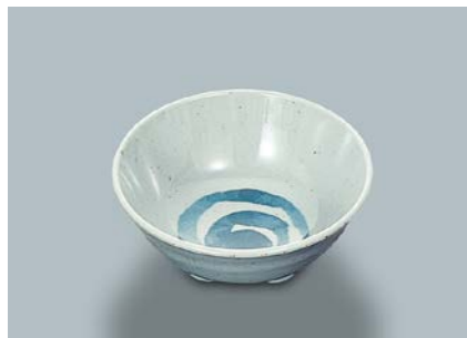
MB-650 F (ふる里)天水 110 × 43 ・ 200ml ¥640