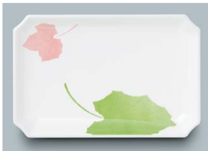
MS-545 HNE(葉音) 角皿 AB