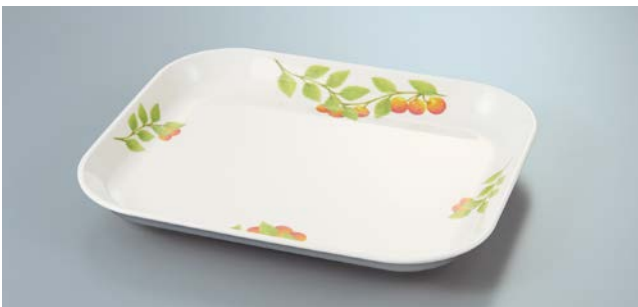
M-253 KNM(木の实) デリカバット 298 × 250 × 34 ・ 1,500ml ¥3,490