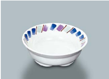
MB-634 F (ふる里)小鉢 115 × 39 ・ 210ml ¥740