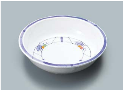
MS-342 NAM(夏目) 丸深皿 160 × 40 ・ 380ml ¥1,110 P-202 ¥380 → P.303 P-203 ¥400 → P.303