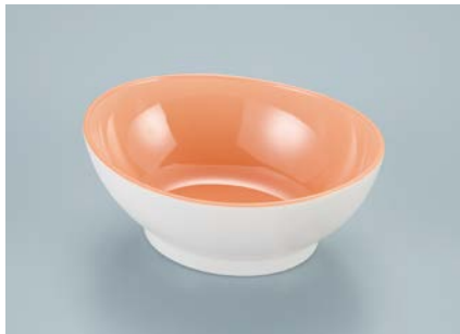
MB-630 VAL(バレンシア)リップボール AB 110 × 95 × 45 ・ 165ml ¥890