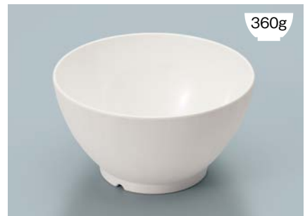
MB-908 W(ホワイト)ライスボール(スリム) AB

POINT ①内側コーティングなので、ご飯がこびりつきにくい飯椀です。 ②ご飯の白さが引き立つカラー。