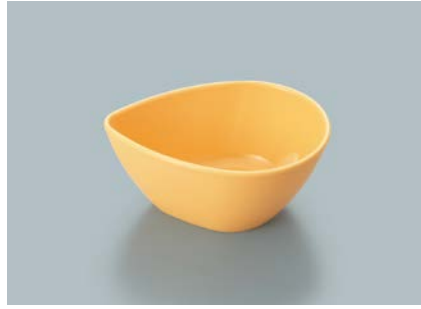
MB-692 MO (メロンオレンジ) しずくボール 104 × 78 × 45 ・ 140ml ¥700