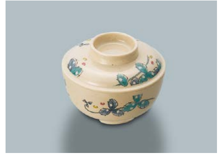
MB-375 MDS (水無月草) 丸小鉢蓋 102 × 28 ¥800