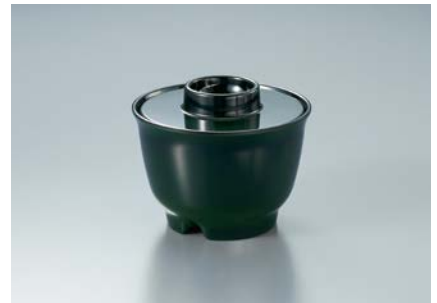
MB-77 GUK(緑内黒) 汁椀蓋 86 × 19 ¥490