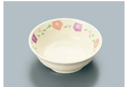
MB-634 HMR (華かんむり)小鉢 115 × 39 ・ 210ml ¥820