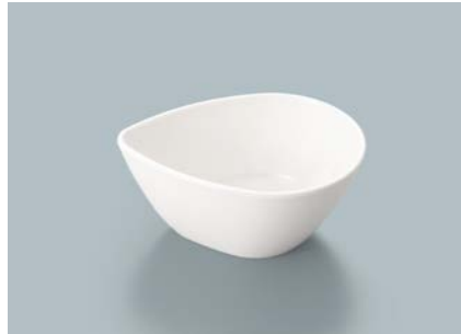
MB-692 W (ホワイト) しずくボール 104 × 78 × 45 ・ 140ml ¥700