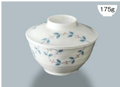
175g 新 MB-973 NTK (南天唐草) 飯椀蓋

新 MB-972 AEK (赤絵小花) 飯椀 AB 124 × 65 ① 94 · 410ml ¥1,050