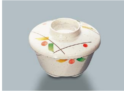
MB-51 SER(セリーン) 深小鉢蓋