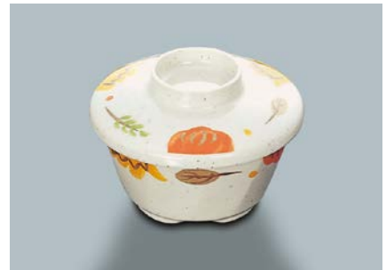
MB-51 CAR(カリブ) 深小鉢蓋