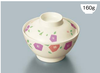
160g MB-609 HMR(華かんむり) 飯椀蓋 111 × 35 ¥640 MB-608 HMR(華かんむり) 飯椀 AB 120 × 64 ① 92・400ml ¥980