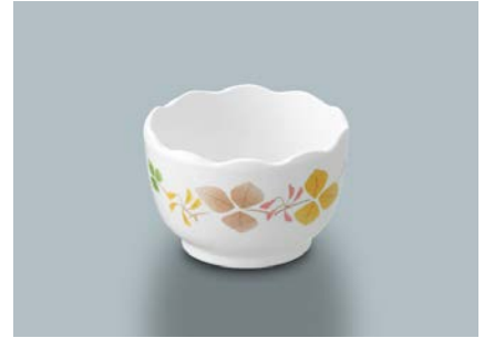
MB-812 HNE(葉音) 波瀾小付 70 × 45 ・ 100ml ¥670