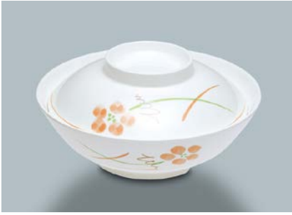
MB-604 YUK(友花) 煮物椀蓋