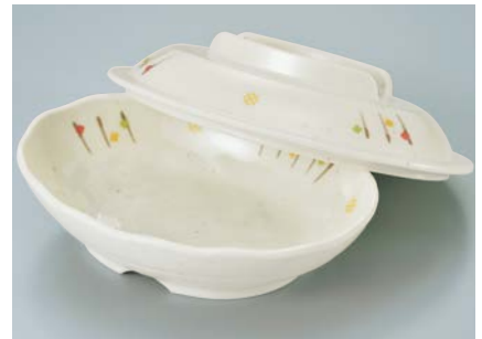
MF-561 ISN (いさ野) 小判皿蓋 176 × 130 × 40 ¥1,320 MS-560 ISN (いさ野) 小判皿 AB 170 × 123 × 40 74 ・ 350ml ¥1,340