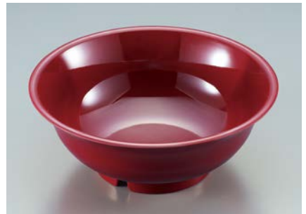
MB-701 R(赤) ラーメン丼 AB 203 × 78 ・ 1,350ml ¥1,430