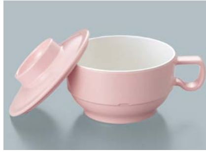
MC-83 SAK (桜) スープカップ蓋