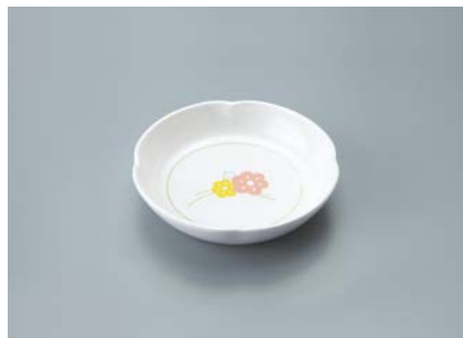
MS-530 KAK(かくれんぼ)小皿 95 × 20 ¥530