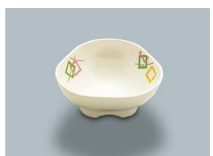
MB-644 F (ふる里) 小鉢 B 88 × 37 ・ 105ml ¥710