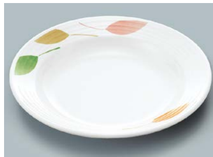
MS-569 HNE(葉音) スープ皿