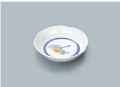
MS-530 NAM(夏目)小皿 95 × 20 ¥510