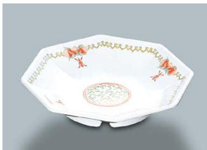
MS-711 CN(中華) 八角鉢 AB 190 × 35 ¥1,140