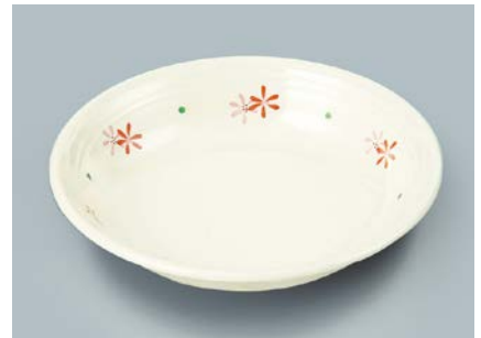
MS-566 HKK(花ころ) クープ皿 A