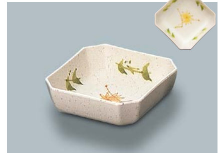
MB-612 F (ふる里) 角小鉢 110 × 110 × 37・250ml ¥830