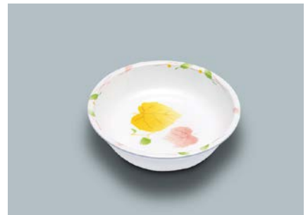
MS-532 HNE(葉音) 深小皿 105 × 25 ・ 130ml ¥570 C-106 ¥330 → P.304