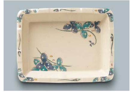
MS-347 MDS (水無月草) 角皿 175 × 135 × 27 ・ 300ml ¥1,150