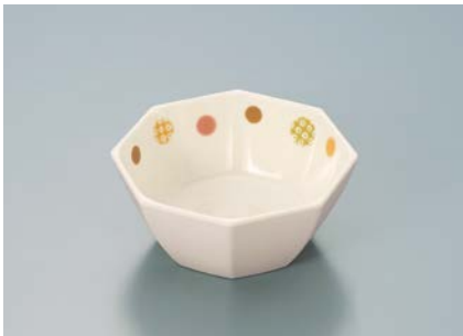
MB-688 EMED (江戸小紋) 八角小鉢 A 89 × 89 × 40 ・ 130ml ¥820