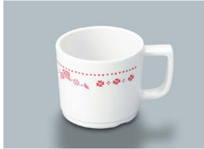
MC-18 SCR(スカーレット) マグカップ 107 × 80 × 70・250ml ¥950 ① P-204 ¥330 → P.304