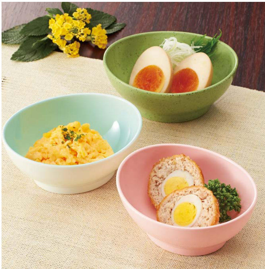
使用食器 | MB-630 P・MMD・GRS リップボール