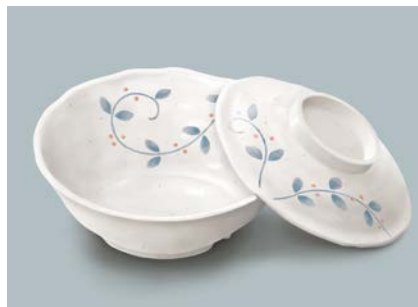
MB-965 NTK(南天唐草) 煮物椀蓋

MB-964 AEK(赤絵小花) 煮物椀 AB 155 × 50 ①71・470ml ¥1,300