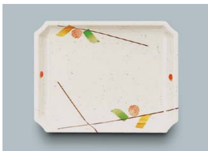
MS-873 SER(セリーン) 角皿 AB 155 × 120 × 21 ¥1,020