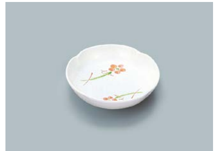
MS-530 YUK(友花)小皿 95 × 20 ¥510