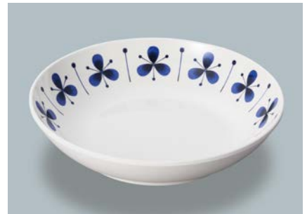
新 MS-246 PIT(ピアット) 深皿 AB 180 × 40 ・ 600ml ¥1,190 C-180 ¥430 → P.302