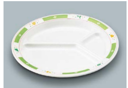
MS-541 GG(グリーンガラス) ミツ仕切皿 A