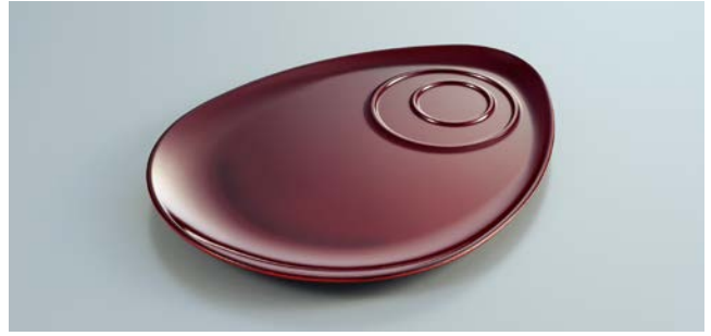
MS-854 T(溜) カフェプレート A 247 × 191 × 17 ¥1,510