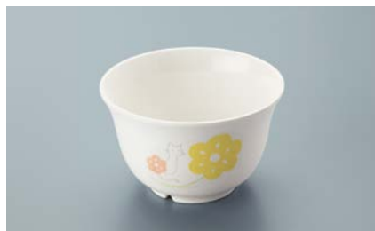
▲ MC-12 KAK(かくれんぼ) 湯呑 95 × 58 ・ 220ml ¥600