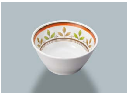
新 MB-276 CRM(カルメラ) フリーカップ AB