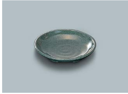
MS-648 WT(枝)和皿 100 × 19 ¥340