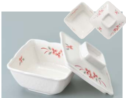
MB-917 AEK(赤絵小花)角小鉢蓋