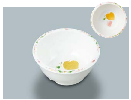
MB-331 HNE(葉音)丸小鉢 100 × 46 ・ 180ml ¥930 C-101 ¥330 → P.304