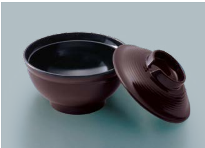
UMF-403 TUK 安定型汁椀蓋 102 × 29 ¥490