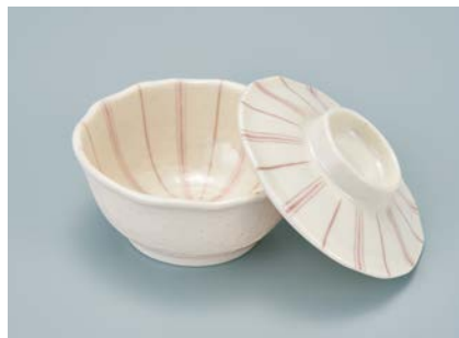
MB-923 TKU(十草)小鉢蓋 104 × 29 ¥710

MB-922 NTK(南天唐草)小鉢 AB 100 × 40 ①63 ・ 160ml ¥890