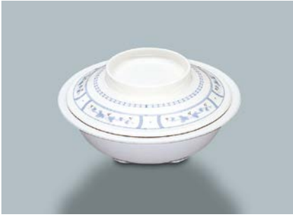
MB-516 BOD(ボルドー) 丸鉢蓋 141 × 33 ¥810 MB-515 W(ホワイト) 丸鉢 AB 156 × 46 ①74 ・ 420ml ¥860