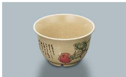
MC-12 F(ふる里) 湯呑 95 × 58 ・ 220ml ¥570