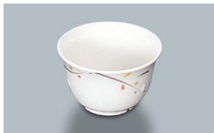
MC-12 LNA(ルナデコール) 湯呑 95 × 58 ・ 220ml ¥550