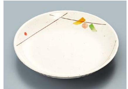
MS-665 SER(セリーン) 菜皿 AB 190 × 30 ¥930 C-190 ¥440 → P.302

使用食器 MS-665 BK 菜皿、P-15 V すのこ、MS-872 KMT 角皿、MS-648 R 和皿、MC-735 R つゆ入れ、TH-220X VUK PBT塗り箸