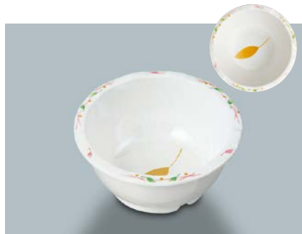
MB-333 HNE(葉音) 丸小鉢 116 × 53 ・ 280ml ¥990 ☞ C-110 ¥330 → P.303