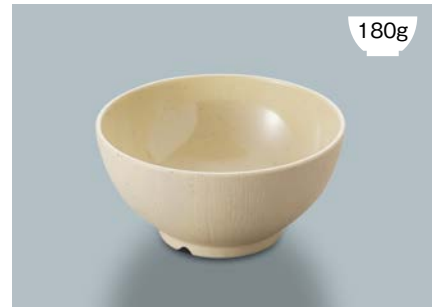
MB-894 CS(クリームストーン) ライスボール(レギュラー) AB 124 × 61 ・ 400ml ¥930