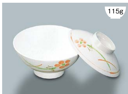
115g MB-804 YUK(友花) 飯茶椀蓋 107 × 30 ¥520