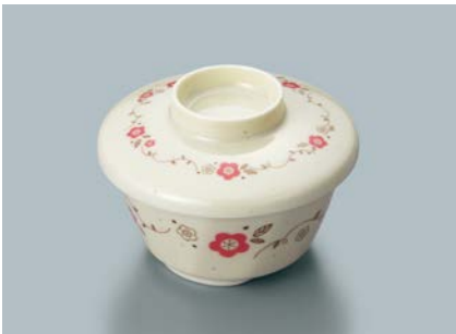
MB-51 HKZ(ひめかずら) 深小鉢蓋