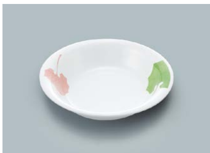
MS-533 HNE(葉音) ベリー皿 140 × 130 × 30 ・ 180ml ¥750 ☞ C-140 ¥340 → P.303