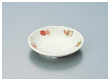
MS-648 EMTD(宝づくし) 和皿 100 × 19 ¥630