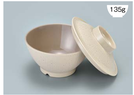
135g MB-905 CS(クリームストーン) ライスボール蓋 121 × 36 ¥560

POINT ①内側コーティングなので、ご飯がこびりつきにくい飯椀です。 ②ご飯の白さが引き立つカラー。