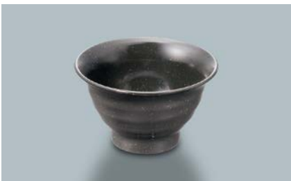
MC-86 KMT(黒マット) 湯呑 95 × 56 ・ 170ml ¥440