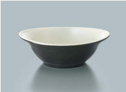
MB-816 KMW(黒マット内白) マルチボール AB 165 × 137 × 55 ・ 410ml ¥1,270