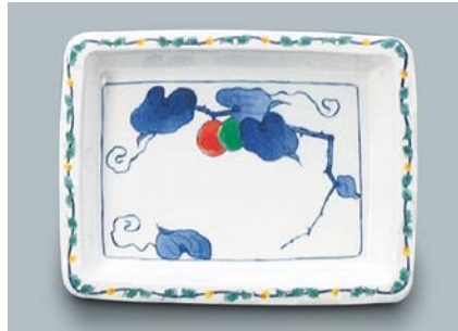
MS-347 FYA (ふる里) 角皿 175 × 135 × 27 ・ 300ml ¥1,140