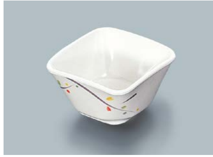
MB-610 LNA (ルナデコール)角小鉢 AB 91 × 91 × 50 ・ 190ml ¥740