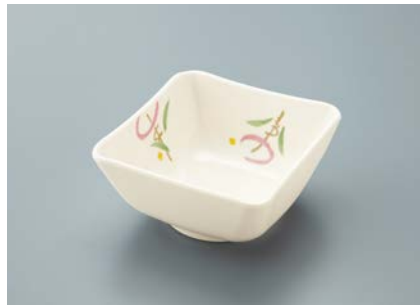
MB-686 FA(ふる里)四角小鉢 AB 89 × 89 × 44 ・ 180ml ¥850 C-1010 ¥320 → P.306