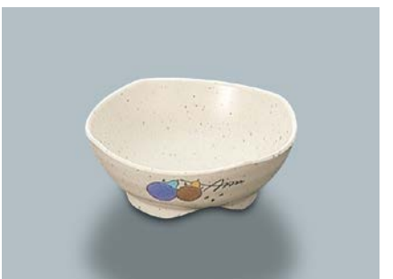
MB-616 FA(ふる里)小鉢 AB