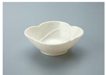
MB-690 FB (ふる里) 花卉小鉢 90 × 33 ・ 100ml ¥660

使用食器 QF-141 TFS ・ QB-140 T ・ QS-147 BK 7.5寸角スタック弁当箱、MB-609 FC ・ MB-900 FC 飯椀、 MB-77 TUK ・ MB-76 TUK 汁椀、MB-688 EMTD 八角小鉢、MB-630 MMD リップボール、 MB-690 FA 花卉小鉢、MB-686 EMED 四角小鉢、PC-83 NBR 湯呑、YB-260 TI 箸置き、TH-220S BK PBT箸