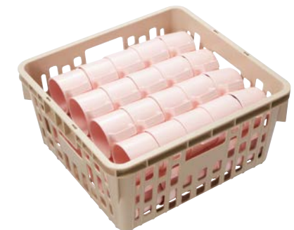
PSK-310Nの使用例 メラミンウェア マグカップ (MC-18 P) × 40個