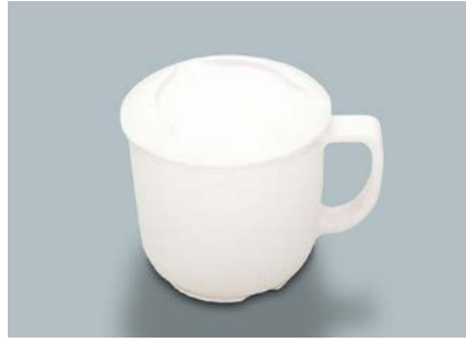
MC-116 W(ホワイト) マグカップ蓋 86 × 17 ¥330 MC-16 W(ホワイト) マグカップ 104 × 80 × 73 ①82・270ml ¥690