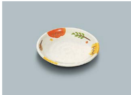
MS-648 CAR(カリブ)和皿 100 × 19 ¥550