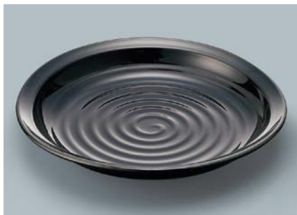
MS-834 KMT(黒マット) かぶと皿 AB