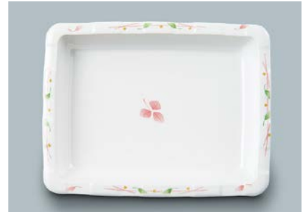
MS-347 HNE (葉音) 角皿 175 × 135 × 27 ・ 300ml ¥1,190