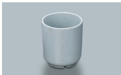
MC-832 FA(ふる里) 切立湯呑 68 × 77 ・ 190ml ¥460 PP-474E ¥250 → P.308