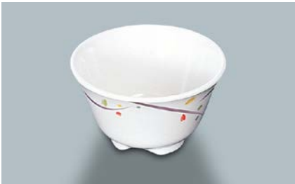
MC-13 LNA(ルナデコール) 湯呑 AB 97 × 55 ・ 200ml ¥550