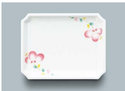
MS-873 F(ふる里) 角皿 AB 155 × 120 × 21 ¥990