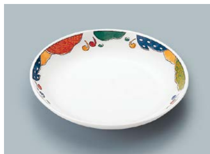
MS-662 BAN(万里) 菜皿 AB