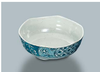
MB-678 F(ふる里) 刺身鉢 AB 148 × 55・540ml ¥1,090