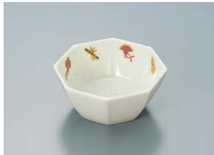
MB-688 EMTD (宝づくし) 八角小鉢 A 89 × 89 × 40 ・ 130ml ¥820