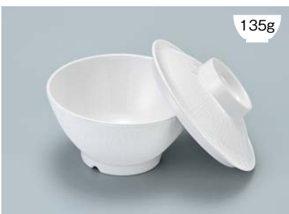
135g MB-905 W(ホワイト) ライスボール蓋 121 × 36 ¥560

POINT ①内側コーティングなので、ご飯がこびりつきにくい飯椀です。 ②ご飯の白さが引き立つカラー。