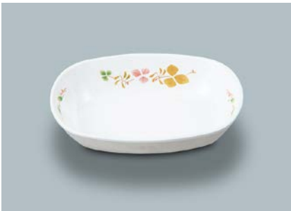
MB-637 HNE (葉音)小判小鉢 AB 133 × 100 × 31 ・ 180ml ¥830 C-1411 ¥400 → P.307