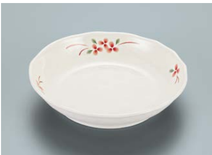
MS-952 AEK(赤絵小花) 深皿 AB 165 × 36 ・ 420ml ¥1,270

☞ C-170 ¥430 → P.302 ☞ P-203 ¥400 → P.303