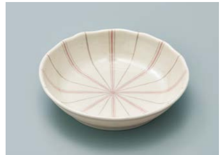
MS-950 TKU(十草) 深皿 AB 154 × 36 ・ 350ml ¥1,230 P-207 ¥420 → P.303