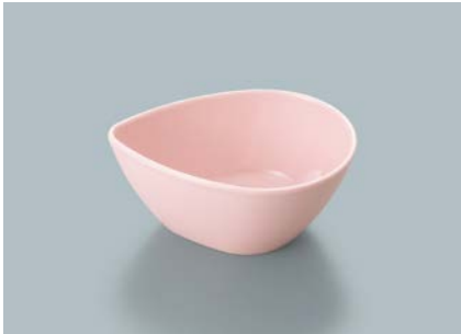
MB-692 SAK (桜) しずくボール 104 × 78 × 45 ・ 140ml ¥700