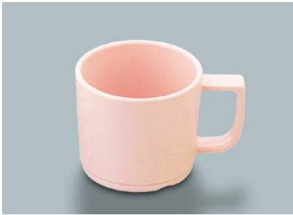
MC-18 P(ピンク) マグカップ 107 × 80 × 70・250ml ¥740 ① P-204 ¥330 → P.304