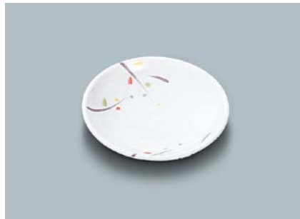
MS-648 LNA(ルナデコール)和皿 100 × 19 ¥550