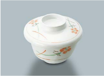
MB-51 YUK(友花) 深小鉢蓋