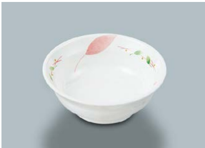
MB-634 HNE (葉音)小鉢 115 × 39 ・ 210ml ¥790