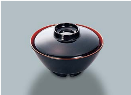
MB-225 KUS(黒内朱) 汁椀蓋 109 × 30 ¥310