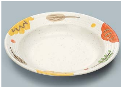
MS-569 CAR(カリブ) スープ皿