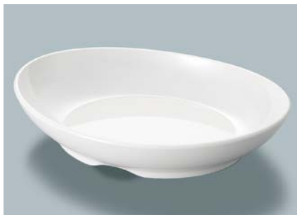
MS-848 W(ホワイト) オーバル皿 AB