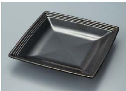
MS-838 KMT(黒マット) スクエアプレート A 160 × 160 × 24 ¥970