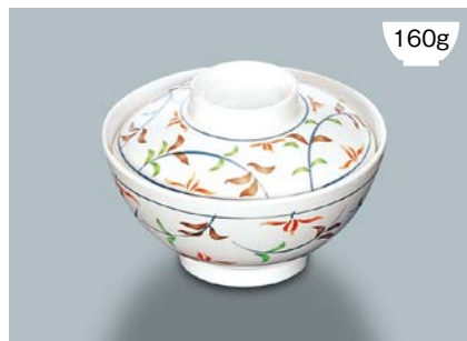
160g MB-575 FA (ふる里) 飯椀蓋

MB-574 F (ふる里) 飯椀 AB 126 × 63 ① 86 · 400ml ¥900