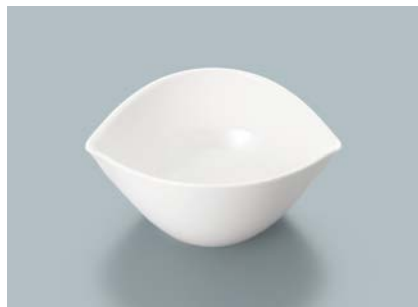
MB-850 W (ホワイト) リーフボール AB 131 × 110 × 55・235ml ¥800