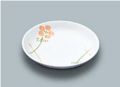
MS-661 YUK(友花) 菜皿 AB 140 × 26 ¥740 C-140 ¥340 → P.303