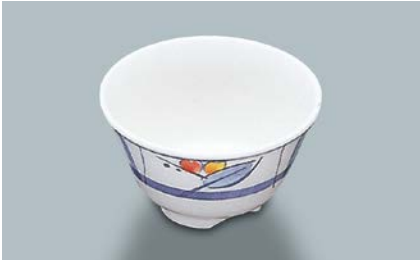
MC-13 NAM(夏目) 湯呑 AB 97 × 55 ・ 200ml ¥550