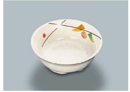
MB-632 SER(セリーン)小鉢 105 × 37 ・ 160ml ¥700 C-106 ¥330 → P.304