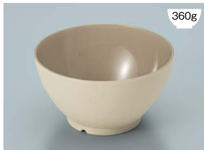
MB-908 CSUK(クリームストーン内黒)ライスボール(スリム) AB

POINT ①内側コーティングなので、ご飯がこびりつきにくい飯椀です。 ②ご飯の白さが引き立つカラー。