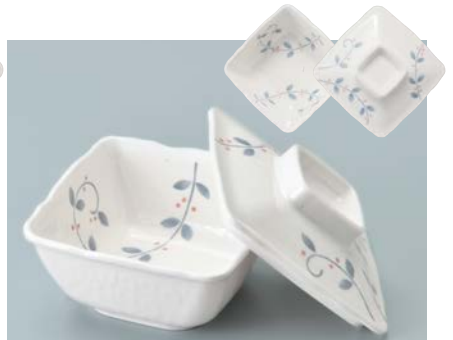
MB-917 NTK(南天唐草)角小鉢蓋