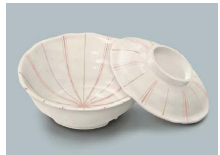
MB-965 TKU(十草) 煮物椀蓋

MB-964 NTK(南天唐草) 煮物椀 AB 155 × 50 ①71・470ml ¥1,300