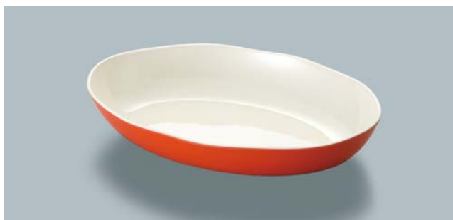
MS-846 OUV(オレンジ内白) オーバル皿 AB 250 × 170 × 68 ・ 900ml ¥1,690