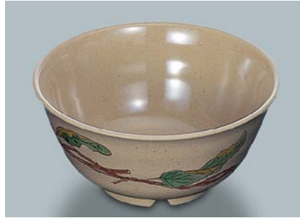
MB-605 FB (ふる里) うどん鉢 AB 180 × 85 ・ 1,170ml ¥1,750 C-180 ¥430 → P.302 UDFU ¥400 → P.308