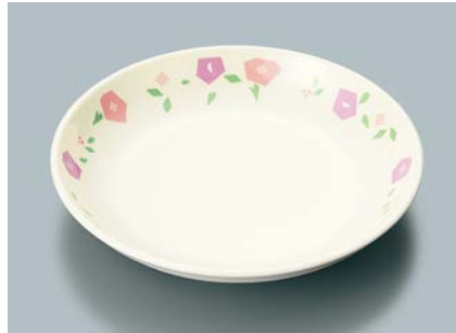
▲MS-664 HMR(華かんむり) 菜皿 AB 180 × 30 ¥900 C-180 ¥430 → P.302