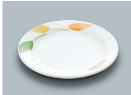
MS-526 HNE(葉音) パン皿 169 × 17 ¥880 C-170 ¥430 → P.302