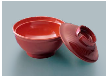
UMF-403 TUS 安定型汁椀蓋 102 × 29 ¥490