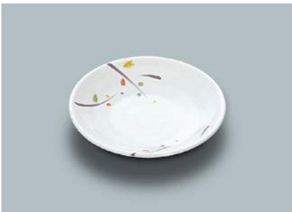
MS-649 LNA(ルナデコール) 和皿 120 × 20 ¥640