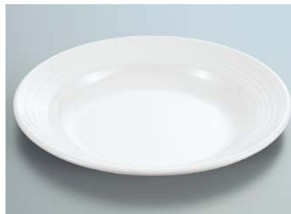
MS-569 W(ホワイト) スープ皿