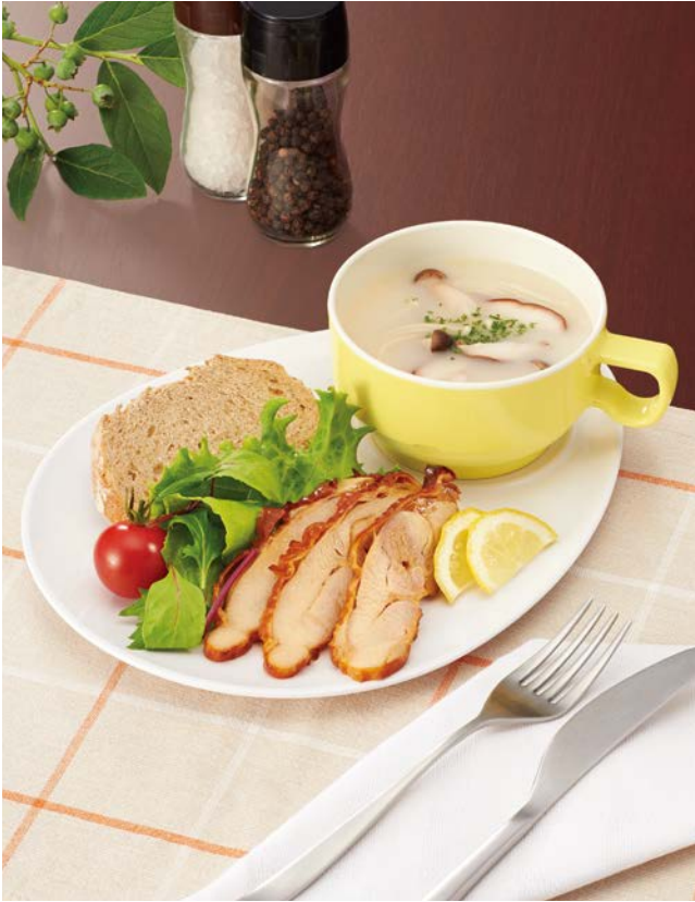
使用食器 | MS-854 W カフェプレート、MC-82 NNUW スープカップ