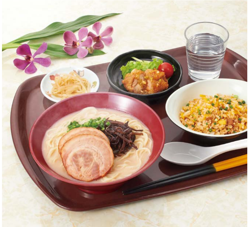
使用食器 | MB-705 R タンメン鉢、MB-816 KMUW マルチボール、MS-763 KMT 取り皿、MS-648 EMTD 小皿、PC-80 AQC コップ、TH-220S KTK PBT塗り箸、SE-26 BR エスタートレイ ※レンゲは参考商品です。