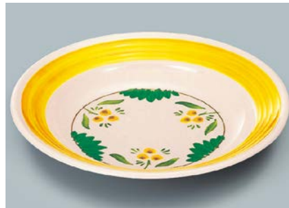
MS-569 DL(デル・レッタ) スープ皿