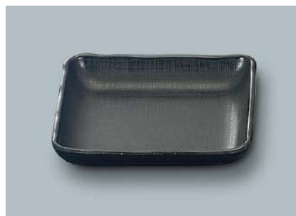
MS-872 KMT(黒マット) 角皿 AB 150 × 150 × 29・350ml ¥880