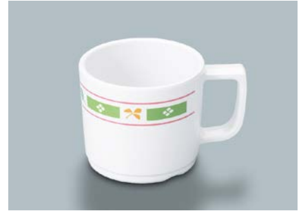
MC-18 GG(グリーンガラス) マグカップ 107 × 80 × 70・250ml ¥950 ① P-204 ¥330 → P.304