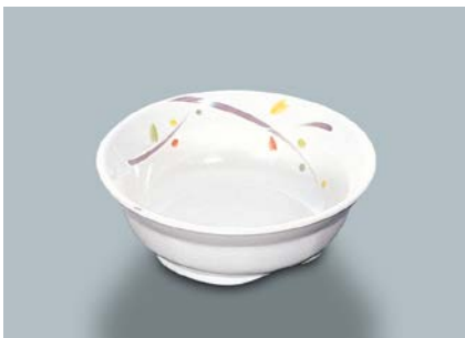
MB-634 LNA (ルナデコール)小鉢 115 × 39 ・ 210ml ¥740