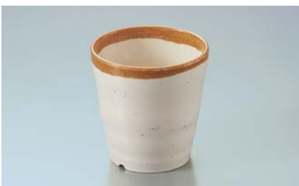
MC-88 WAB(わび) 湯呑 77 × 78 ・ 220ml ¥900 P-204 ¥330 → P.304 PPF-507 ¥310 → P.308