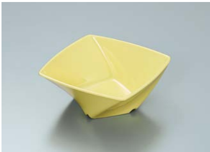
MB-680 LMY(ライムイエロー) ツイストボール A 110 × 110 × 45 ・ 230ml ¥710