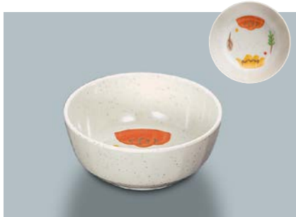
MB-647 CAR(カリブ) 丸小鉢 110 × 45 ・ 270ml ¥650