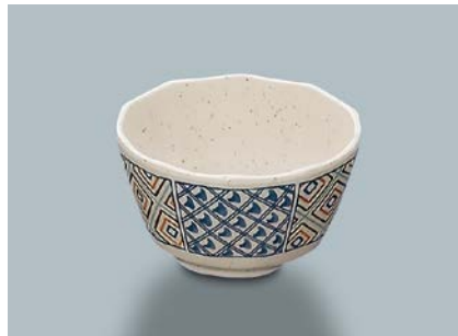
MB-618 F(ふる里) 深小鉢