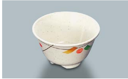
MC-13 SER(セリン) 湯呑 AB 97 × 55 ・ 200ml ¥550