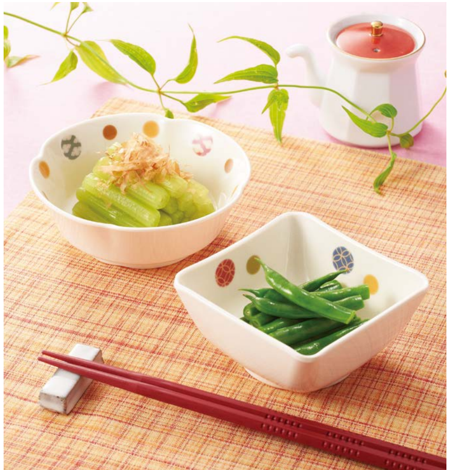
使用食器 | MB-620 EMED 丸小鉢、MB-686 EMED 四角小鉢