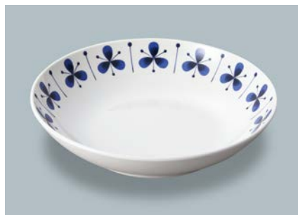
新 MS-248 PIT (ピアット) 深皿 AB 198 × 43 ・ 780ml ¥1,350 C-200 ¥470 → P.302