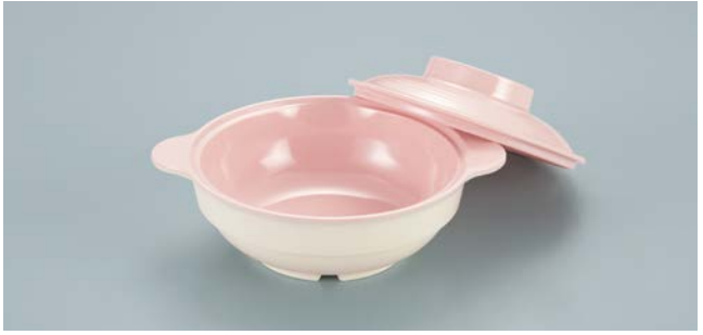
MB-85 SAK (桜) スープボール蓋

POINT ①一つひとつの風合いが異なる陶磁器の釉をかけたようなグラデーションです。 ②スープボールですが、煮物椀としても活躍します。