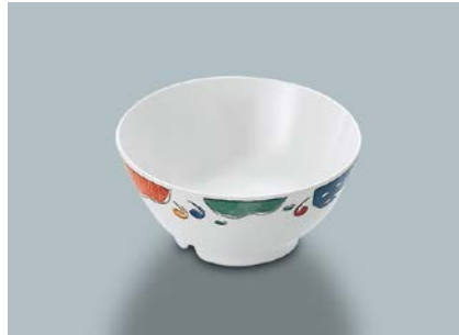
MB-2 BAN(万里) 汁椀 113 × 52 ・ 290ml ¥730