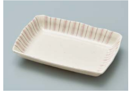
MS-956 TKU (十草) 角皿 AB 170 × 122 × 28 ・ 270ml ¥1,240 C-1712 ¥450 → P.305