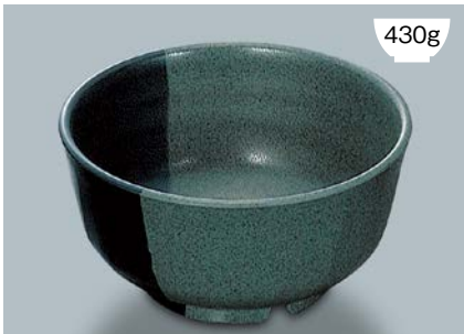
MB-595 WF (技) 多用丼 AB 160 × 82 ・ 950ml ¥1,120 P-203 ¥400 → P.303 C-160 ¥460 → P.303 71M ¥950 → P.308