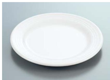
MS-527 W (ホワイト) ライス皿 AB 190 × 19 ¥840 C-190 ¥440 → P.302