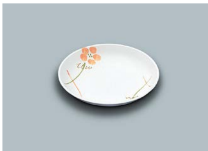
MS-648 YUK(友花) 和皿 100 × 19 ¥550