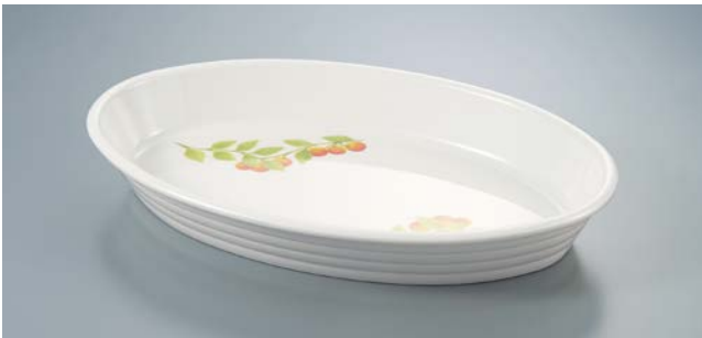
D-2010 KNM(木の实) オーバルデリ 404 × 240 × 62 ・ 3,000ml ¥5,480