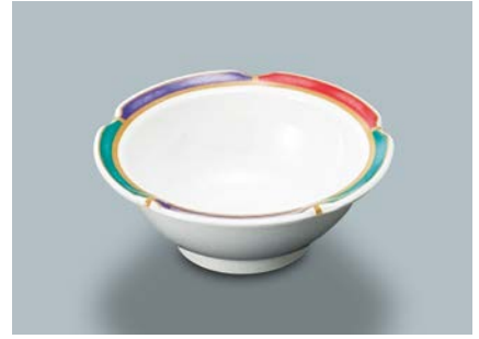
G-796 FYA (ふる里) 丸小鉢 AB 110 × 42 ・ 125ml ¥720