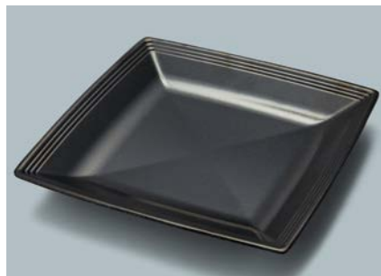
MS-840 KMT(黒マット) スクエアプレート AB