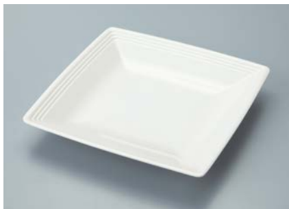
MS-838 SW(白雪) スクエアプレート A 160 × 160 × 24 ¥970