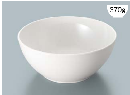
MB-826 W(ホワイト)フリーボール AB