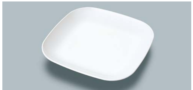
MS-844 W(ホワイト) フリープレート AB 230 × 230 × 30 ¥1,670 W-2323 ¥430 → P.307