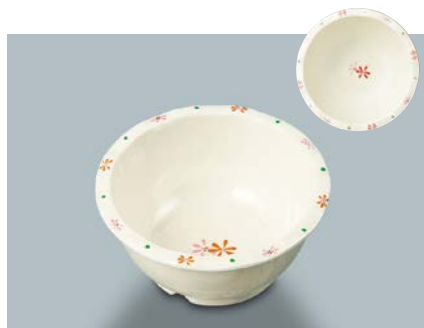
MB-333 HKK(花ころも) 丸小鉢 116 × 53 ・ 280ml ¥990 ☞ C-110 ¥330 → P.303