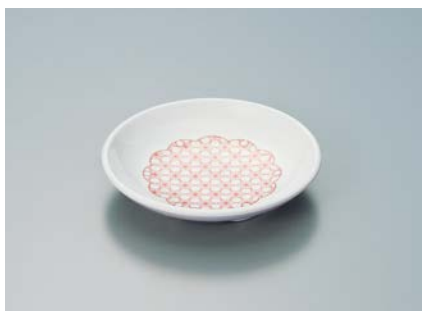
MS-648 EMAS(麻の葉) 和皿 100 × 19 ¥630