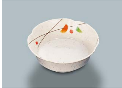
MB-620 SER(セリン)丸小鉢 AB 110×40・180ml ¥790 C-110 ¥330→P.303