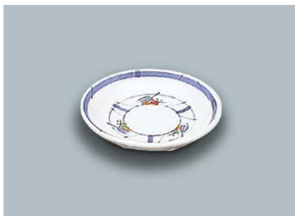
MS-648 NAM(夏目) 和皿 100 × 19 ¥550