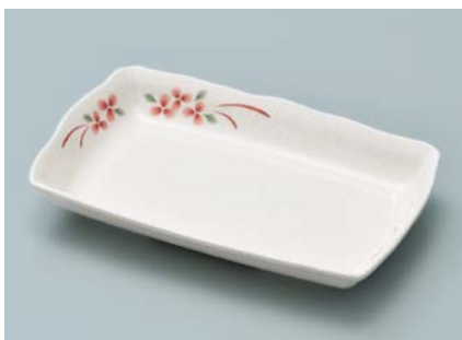
MS-958 AEK(赤絵小花) 長角皿 AB