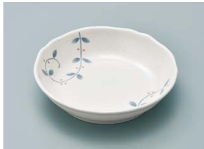
MS-950 NTK(南天唐草) 深皿 AB 154 × 36 ・ 350ml ¥1,230 P-207 ¥420 → P.303