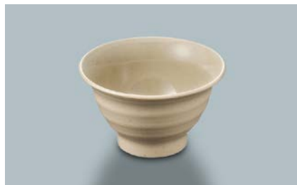
MC-86 SX(砂石焼) 湯呑 95 × 56 ・ 170ml ¥440