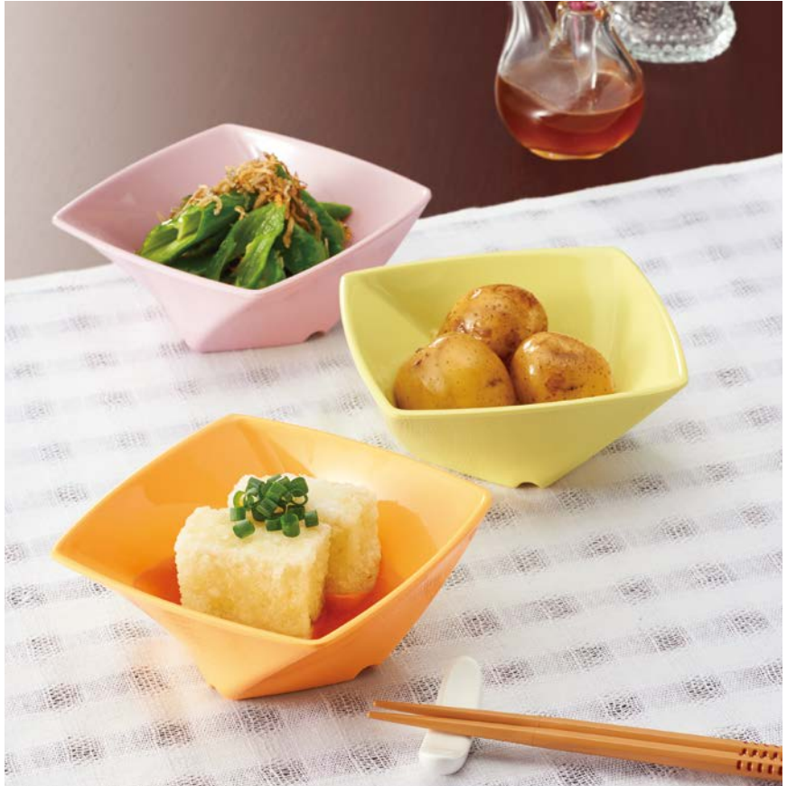
使用食器 | MB-680 (SAK・LMY・MO) ツイストボール