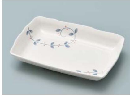
MS-956 NTK (南天唐草) 角皿 AB 170 × 122 × 28 ・ 270ml ¥1,240 C-1712 ¥450 → P.305