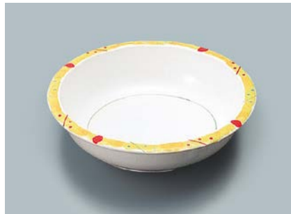
MS-342 FYA(ふる里) 丸深皿 160 × 40 ・ 380ml ¥1,110 P-202 ¥380 → P.303 P-203 ¥400 → P.303