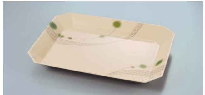
D-1015 EMOR(繊維部) デリカバット 360 × 270 × 35 ・ 1,700ml ¥3,870