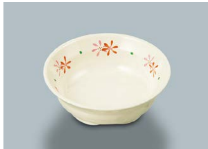
MB-634 HKK (花ころも)小鉢 115 × 39 ・ 210ml ¥820