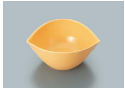
MB-850 MO (メロンオレンジ) リーフボール AB 131 × 110 × 55・235ml ¥800