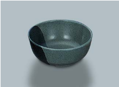
MB-647 WF(技) 丸小鉢 110 × 45 ・ 270ml ¥550