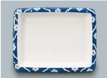
MS-347 F (ふる里) 角皿 175 × 135 × 27 ・ 300ml ¥1,100