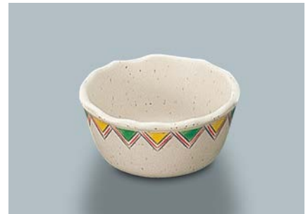
MB-621 F (ふる里) 丸小鉢 91 × 43 ・ 140ml ¥610