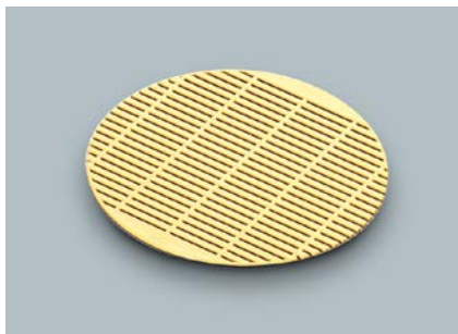
P-15 V(ベージュ) すのこ φ150 ¥250 ※ポリプロピレン製 (MS-665対応サイズ)