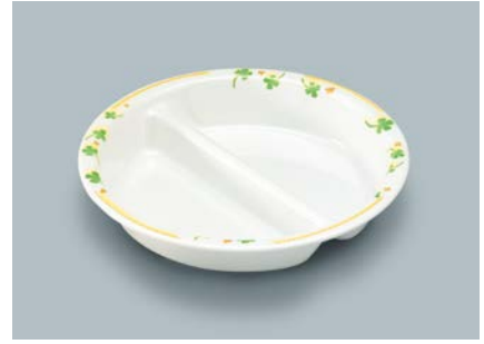
MS-874 HPY (ハッピー) ニツ仕切皿 176 × 34 ¥1,420