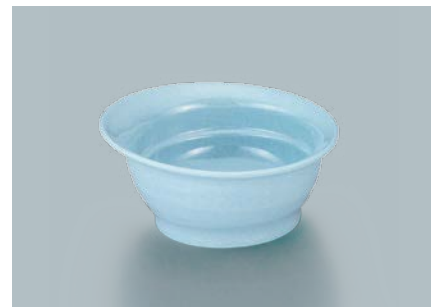
UMB-478 SOR(空)傾斜丸小鉢 105 × 49 ・ 140ml ¥620 POINT すべり止め加工付もあります。(→P.255)