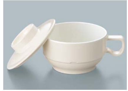
MC-83 V (ベージュ) スープカップ蓋