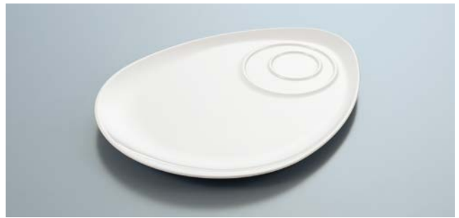
MS-854 W(ホワイト) カフェプレート A 247 × 191 × 17 ¥1,510