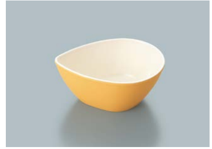
MB-692 MOUW (メロンオレンジ内白) しずくボール 104 × 78 × 45 ・ 140ml ¥700