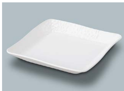
MS-830 SW(白雪) 角皿 AB