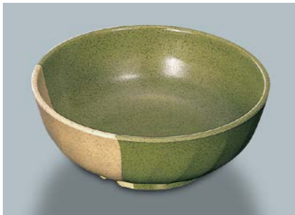
MB-599 WM(技) 麵鉢 AB 200 × 77 ・ 1,400ml ¥1,600 C-200 ¥470 → P.302