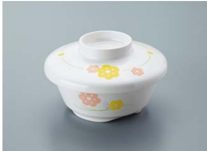
▲MB-51 KAK(かくれんぼ)小鉢蓋