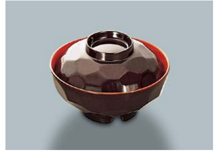
MB-220 TUS(溜内朱) 亀甲汁椀蓋 108 × 34 ¥360