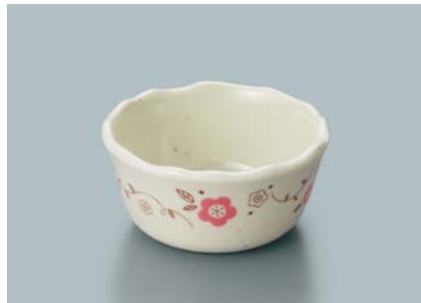
MB-621 HKZ (ひめかずら) 丸小鉢 91 × 43 ・ 140ml ¥660