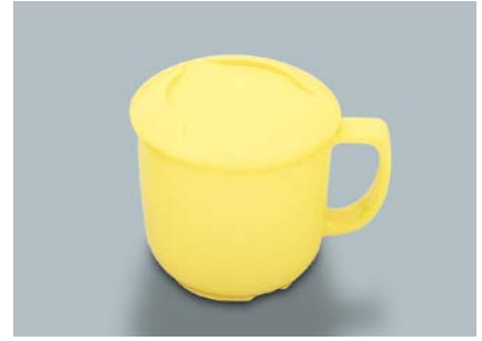
MC-116 Y(イエロー) マグカップ蓋 86 × 17 ¥330 MC-16 Y(イエロー) マグカップ 104 × 80 × 73 ①82・270ml ¥690