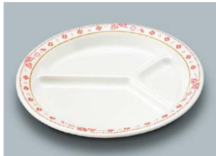
MS-541 SCR(スカーレット) ミツ仕切皿 A