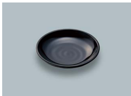
MS-648 KMT(黒マット) 和皿 100 × 19 ¥370