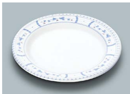
MS-527 BOD (ボルドー) ライス皿 AB 190 × 19 ¥970 C-190 ¥440 → P.302