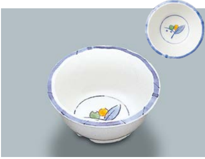
MB-331 NAM(夏目)丸小鉢 100 × 46 ・ 180ml ¥840 C-101 ¥330 → P.304