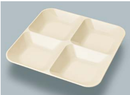
MS-856 V (ベージュ) フォープレート AB 230 × 230 × 33 ¥2,540

使用食器 | MS-844 V フリープレート、MS-856 V フォープレート