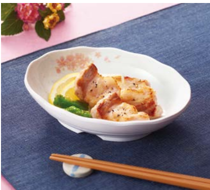
使用食器 | MS-560 EMSK 小判皿