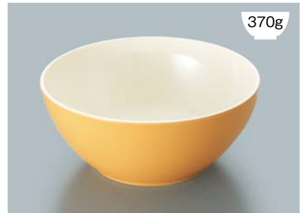
MB-826 MOUW(メロンオレンジ内白)フリーボール AB