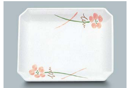
MS-647 YUK (友花) 角皿 AB 175 × 135 × 21 ¥1,070