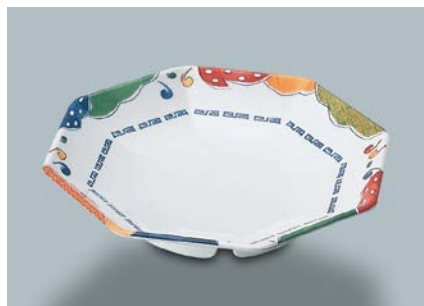
MS-711 BAN(万里) 八角鉢 AB 190 × 35 ¥1,220