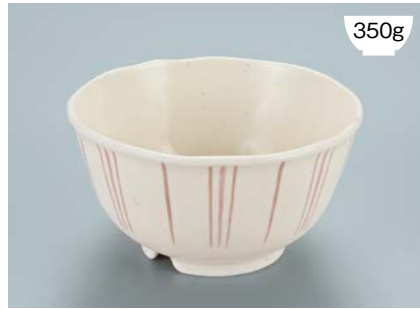
MB-942 TKU (十草) 丼 AB 150 × 80 ・ 780ml ¥1,360 P-202 ¥380 → P.303 P-207 ¥420 → P.303