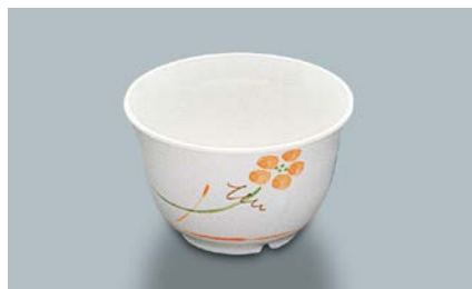
MC-12 YUK(友花) 湯呑 95 × 58 ・ 220ml ¥560