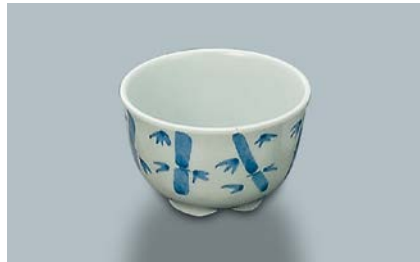
MC-14 F(ふる里) 湯呑 86 × 55 ・ 190ml ¥570