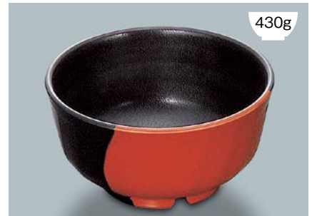
MB-595 WS (技) 多用丼 AB 160 × 82 ・ 950ml ¥1,120 P-203 ¥400 → P.303 C-160 ¥460 → P.303 71M ¥950 → P.308