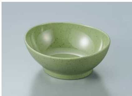
MB-630 GRS(グリーンストーン)リップボール AB 110 × 95 × 45 ・ 165ml ¥890