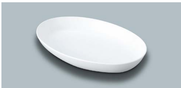
MS-836 SW(白雪) 楕円皿 AB 240 × 155 × 35 ・ 660ml ¥1,140