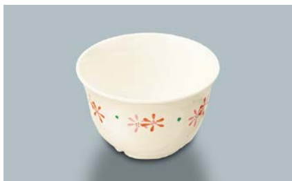
MC-12 HKK(花ころも) 湯呑 95 × 58 ・ 220ml ¥570