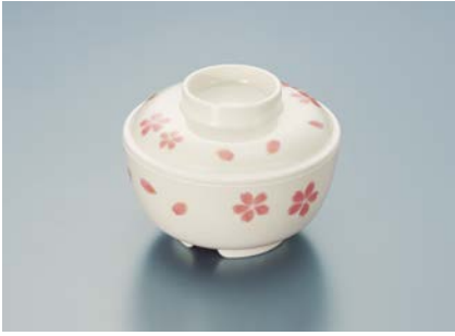
MB-375 EMBS (ぼかし桜) 丸小鉢蓋 102 × 28 ¥800