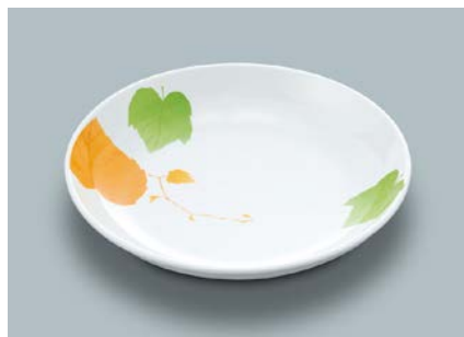
MS-662 HNE(葉音) 菜皿 AB