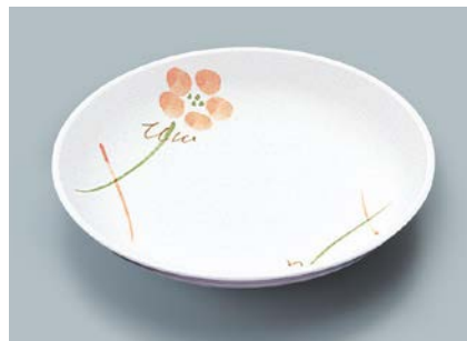
MS-664 YUK(友花) 菜皿 AB 180 × 30 ¥860 C-180 ¥430 → P.302