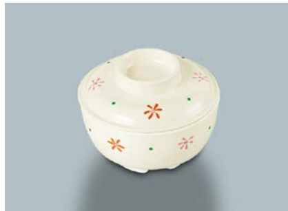
MB-375 HKK (花ころ) 丸小鉢蓋 102 × 28 ¥800