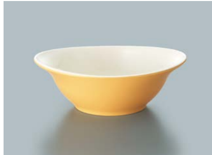
MB-816 MOUW(メロンオレンジ内白) マルチボール AB 165 × 137 × 55 ・ 410ml ¥1,270