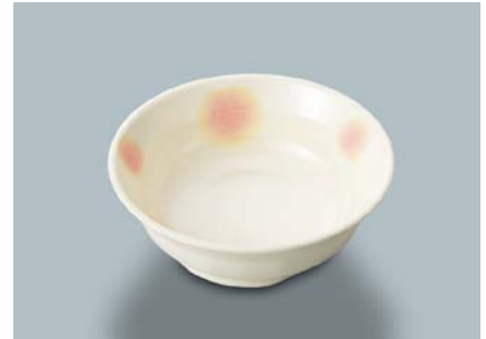
MB-634 FB (ふる里)小鉢 115 × 39 ・ 210ml ¥790