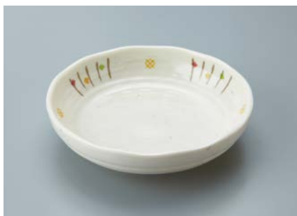
MS-765 ISN(いさ野) 深皿 AB 150 × 37 ・ 300ml ¥1,500 ☞ P-207 ¥420 → P.303