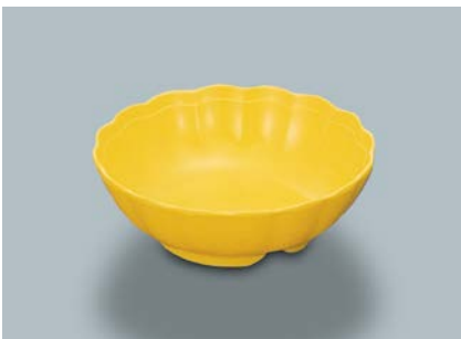
M-102 Y(イエロー)菊型小鉢 AB 112 × 38 ・ 170ml ¥640 C-110 ¥330 → P.303