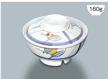
160g MB-575 NAM (夏目) 飯椀蓋