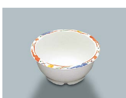
MB-333 F(ふる里) 丸小鉢 116 × 53 ・ 280ml ¥840 ☞ C-110 ¥330 → P.303