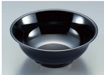
MB-701 BK(黒) ラーメン丼 AB 203 × 78 ・ 1,350ml ¥1,430