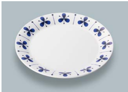
新 MS-150 PIT(ピアット) パン皿 AB 170 × 17 ¥980 C-170 ¥430 → P.302