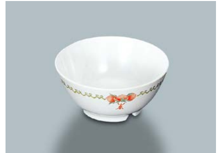
MB-2 CN(中華) 汁椀 113 × 52 ・ 290ml ¥640