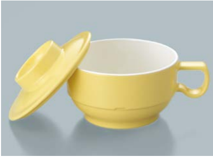
MC-83 NAN (菜の花) スープカップ蓋