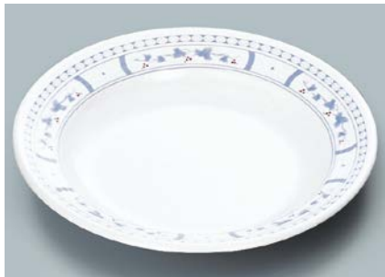
MS-569 BOD(ボルドー) スープ皿