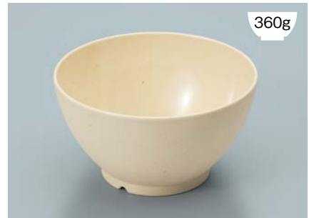
MB-908 CS(クリームストーン)ライスボール(スリム) AB