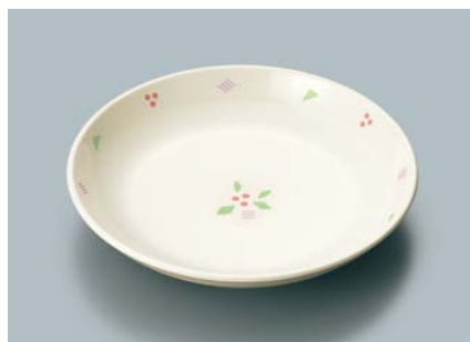
▲ MS-662 HMR(華かんむり) 菜皿 AB