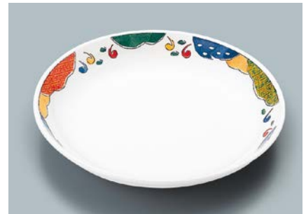
MS-665 BAN(万里) 菜皿 AB 190 × 30 ¥990 C-190 ¥440 → P.302