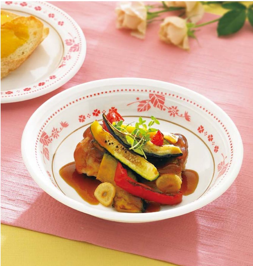
使用食器 | MS-566 SCR クープ皿、MS-526 SCR パン皿