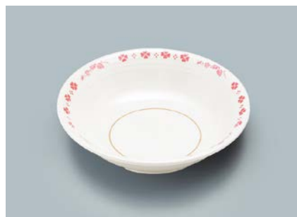
MS-564 SCR(スカレット) ベリー皿 140 × 35 ・ 280ml ¥800 ☞ C-140 ¥340 → P.303