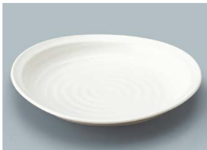
MS-834 SW(白雪) かぶと皿 AB