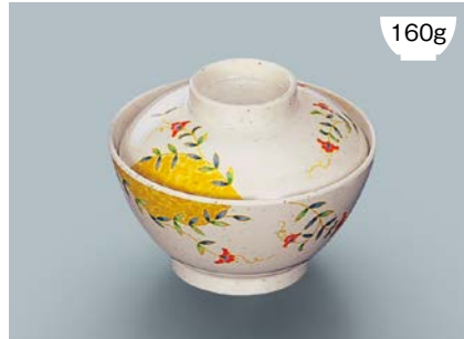
160g MB-609 FA(ふる里) 飯椀蓋 111 × 35 ¥590 MB-608 FA(ふる里) 飯椀 AB 120 × 64 ① 92・400ml ¥930