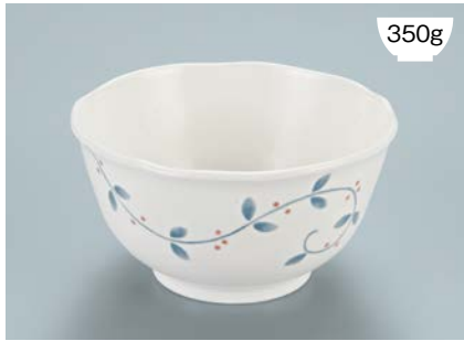
MB-942 NTK (南天唐草) 丼 AB 150 × 80 ・ 780ml ¥1,360 P-202 ¥380 → P.303 P-207 ¥420 → P.303