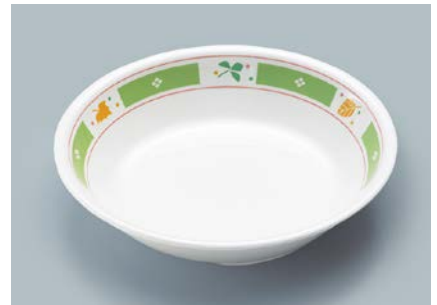
MS-2120 GG (グリーンガラス) カレー皿 198 × 43 ・ 720ml ¥1,180 ☎ C-200 ¥470 → P.302