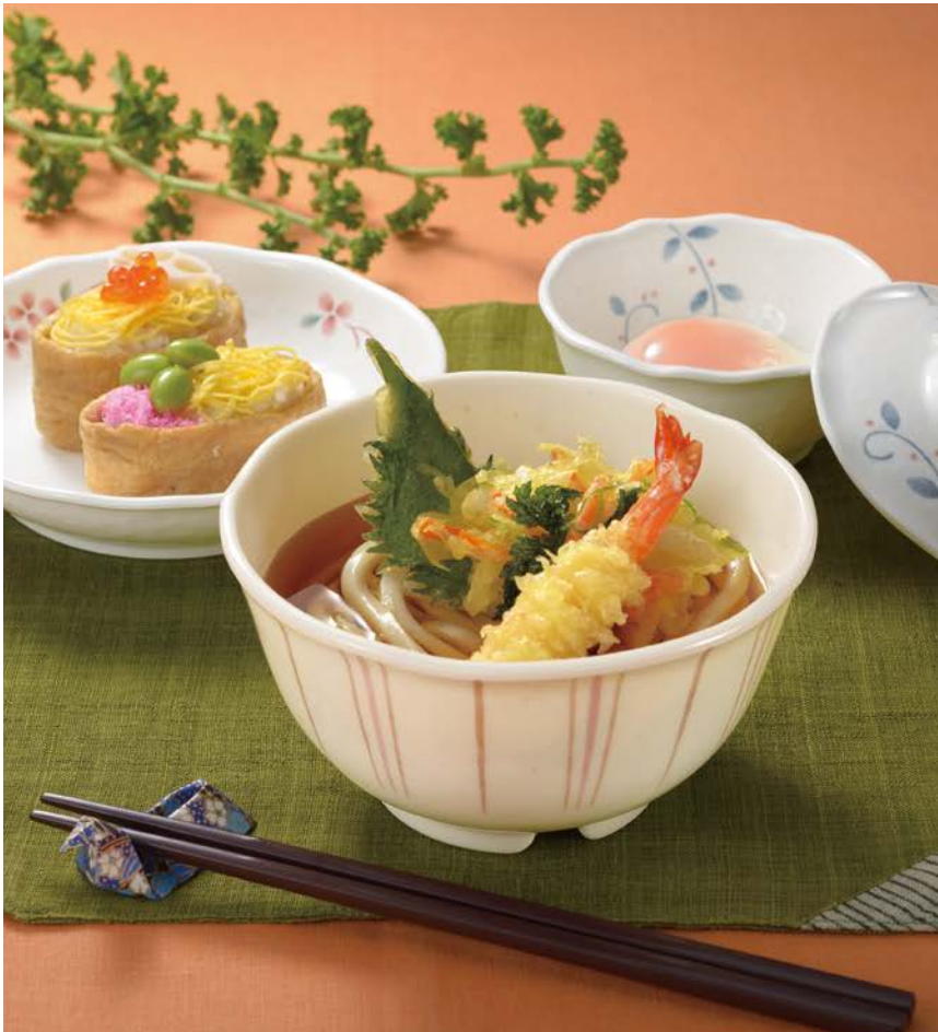
使用食器 | MB-942 TKU 丼、MS-952 AEK 深皿、MB-927 NTK・MB-926 NTK 小鉢、AH-225 AA アミハード箸