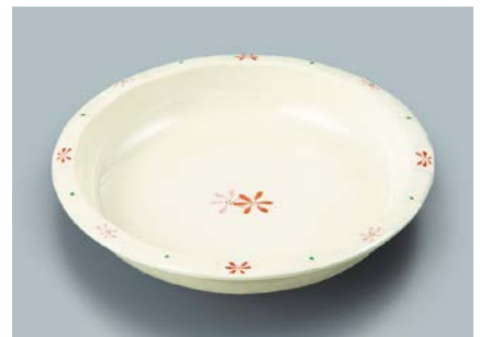
MS-345 HKK(花ころ) 丸深皿 180 × 34 ・ 440ml ¥1,170 C-180 ¥430 → P.302