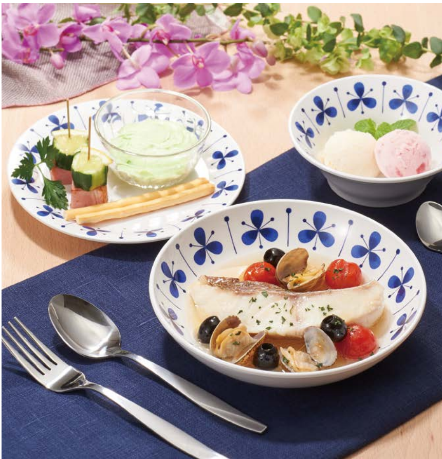
使用食器 | CB-87 AQC 小鉢、MS-150 PIT パン皿、MB-180 PIT サラダボール、MS-246 PIT 深皿、TAS-01 デザートスプーン、TAS-02 デザートフォーク