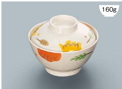
160g MB-609 CAR(カリブ) 飯椀蓋 111 × 35 ¥570 MB-608 CAR(カリブ) 飯椀 AB 120 × 64 ① 92・400ml ¥890