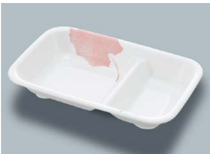
MS-558 HNE (葉音) 角仕切皿 194 × 124 × 32 ¥1,140