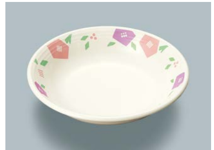
MS-566 HMR(華かんむり) クープ皿 A