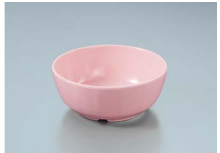
MB-647 SAK(桜) 丸小鉢 110 × 45 ・ 270ml ¥560