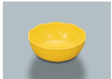
M-103 Y (イエロー) 十草小鉢 AB 111 × 43・230ml ¥640