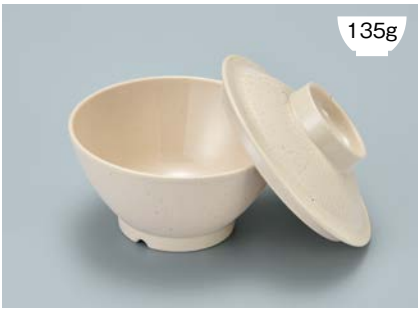
135g MB-905 CS(クリームストーン) ライスボール蓋 121 × 36 ¥560