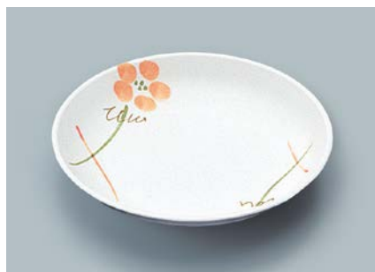
MS-662 YUK(友花) 菜皿 AB