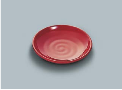
MS-648 R(赤)和皿 100 × 19 ¥340