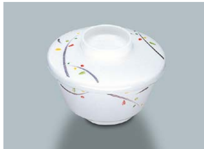
MB-51 LNA(ルナデコール) 深小鉢蓋