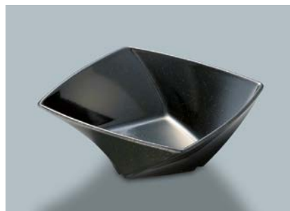
MB-684 KMT(黒マット) ツイストボール AB 170 × 170 × 65・800ml ¥1,200