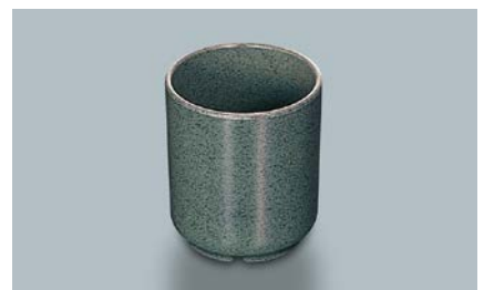
MC-832 WT(技) 切立湯呑 68 × 77 ・ 190ml ¥460 PP-474E ¥250 → P.308