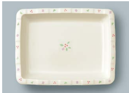
▲ MS-347 HMR (華かんむり) 角皿 175 × 135 × 27 ・ 300ml ¥1,190