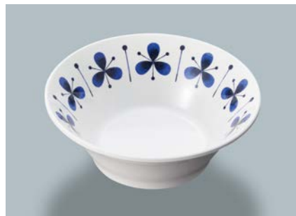
新 MB-180 PIT(ピアット) サラダボール AB 130 × 46 ・ 280ml ¥970 ☞ P-206 ¥380 → P.303