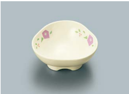
MB-644 HMR (華かんむり) 小鉢 B 88 × 37 ・ 105ml ¥710