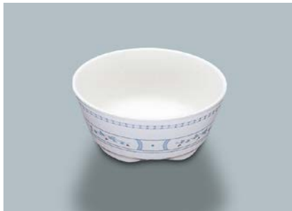
MB-50 BOD(ボルドー)小鉢 AB