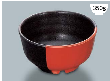
MB-593 WS (技) 多用丼 AB 150 × 78 ・ 780ml ¥1,070 P-202 ¥380 → P.303 P-207 ¥420 → P.303 71S ¥860 → P.308