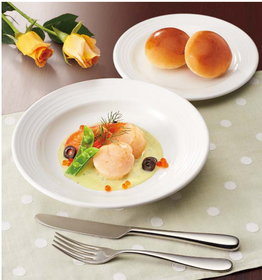
使用食器 | MS-569 W スープ皿、MS-527 W ライス皿