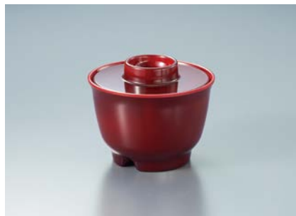
MB-77 TUS(溜内朱) 汁椀蓋 86 × 19 ¥490