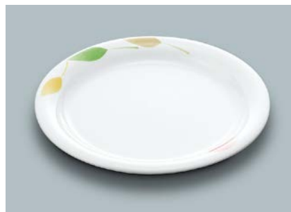
MS-523 HNE (葉音) ライス皿 195 × 18 ¥950 C-200 ¥470 → P.302