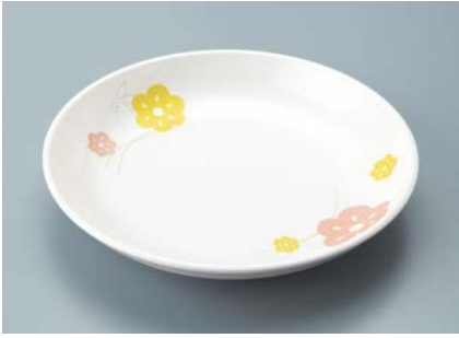
▲MS-664 KAK(かくれんぼ) 菜皿 AB 180 × 30 ¥930 C-180 ¥430 → P.302