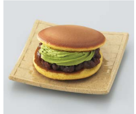
使用食器 | M-104 CX 平角皿