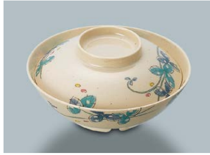
MB-604 MDS(水無月草) 煮物椀蓋