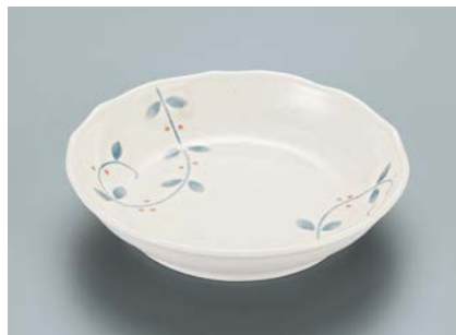
MS-952 NTK(南天唐草) 深皿 AB 165 × 36 ・ 420ml ¥1,270

☞ C-170 ¥430 → P.302 ☞ P-203 ¥400 → P.303