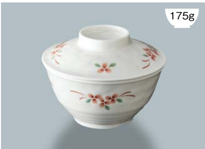
175g 新 MB-973 AEK (赤絵小花) 飯椀蓋