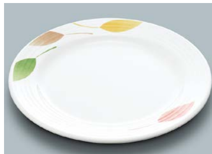
MS-528 HNE(葉音) ミート皿