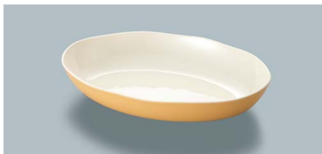
MS-846 MOUW(メロンオレンジ内白) オーバル皿 AB 250 × 170 × 68 ・ 900ml ¥1,690