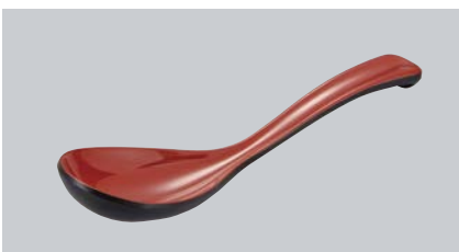
M-590 KUS (黒内朱) チリレンゲ