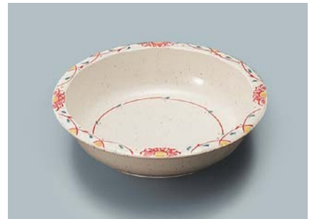
MS-342 FYB(ふる里) 丸深皿 160 × 40 ・ 380ml ¥1,110 P-202 ¥380 → P.303 P-203 ¥400 → P.303