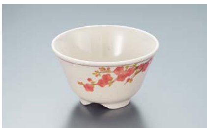
MC-13 EMUM(梅) 湯呑 AB 97 × 55 ・ 200ml ¥640