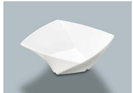
MB-682 W(ホワイト) ツイストボール AB