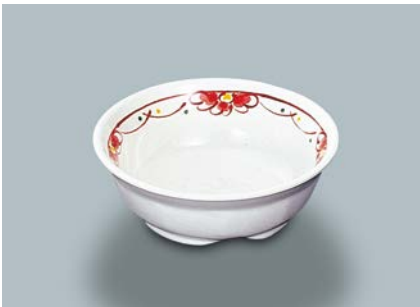
MB-632 F(ふる里)小鉢 105 × 37 ・ 160ml ¥700 C-106 ¥330 → P.304