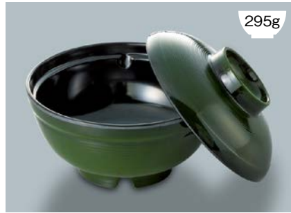
MB-787 GUK (緑内黒) 飯丼蓋 140 × 41 ¥760 MB-786 GUK (緑内黒) 飯丼 AB 150 × 76 ①105 ・ 740ml ¥1,090