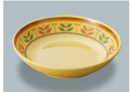
新 MS-246 CMM(カルメラマスタード) 深皿 AB 180 × 40 ・ 600ml ¥1,230 C-180 ¥430 → P.302