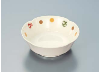
MB-620 EMED(江戸小紋)丸小鉢 AB 110×40・180ml ¥850 C-110 ¥330→P.303