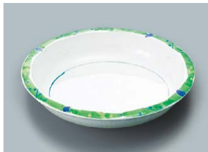
MS-345 F(ふる里) 丸深皿 180 × 34 ・ 440ml ¥1,170 C-180 ¥430 → P.302