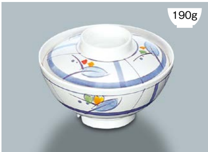
190g MB-577 NAM (夏目) 飯椀蓋