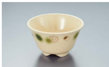
MC-13 EMOR(織部) 湯呑 AB 97 × 55 ・ 200ml ¥640