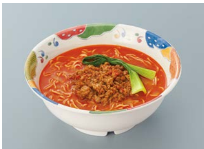
使用食器 | MB-701 BAN ラーメン丼