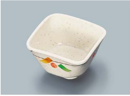
MB-610 SER (セリーン)角小鉢 AB 91 × 91 × 50 ・ 190ml ¥750