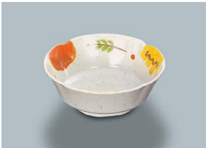
MB-620 CAR(カリブ)丸小鉢 AB 110×40・180ml ¥790 C-110 ¥330→P.303