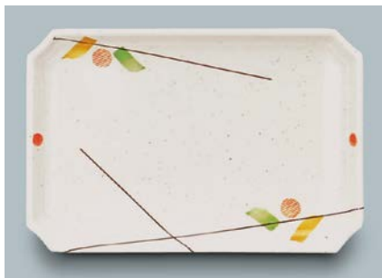
MS-545 SER(セリーン) 角皿 AB