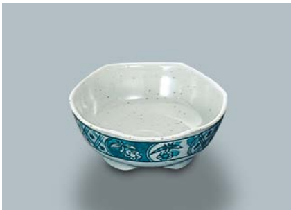
MB-676 F(ふる里) 小付 AB 84 × 34 ・ 90ml ¥500