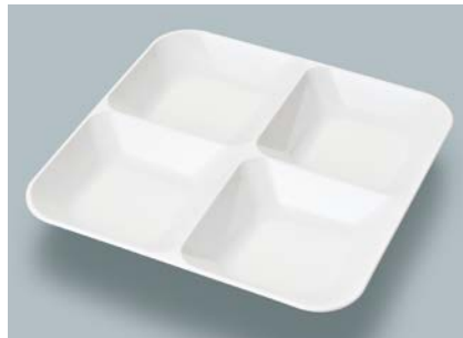
MS-856 W (ホワイト) フォープレート AB 230 × 230 × 33 ¥2,540