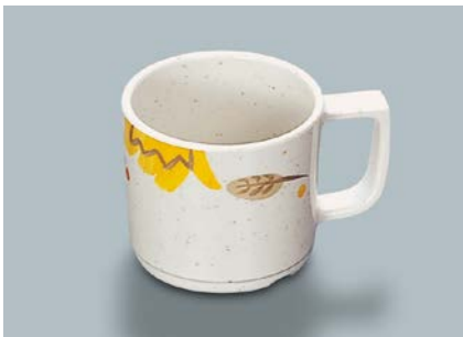
MC-18 CAR(カリブ) マグカップ 107 × 80 × 70・250ml ¥940 ① P-204 ¥330 → P.304