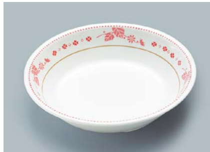
MS-2120 SCR (スカーレット) カレー皿 198 × 43 ・ 720ml ¥1,180 ☎ C-200 ¥470 → P.302