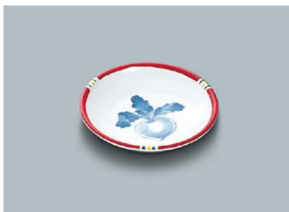
MS-648 F(ふる里) 和皿 100 × 19 ¥530