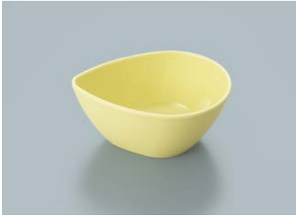
MB-692 LMY (ライムイエロー) しずくボール 104 × 78 × 45 ・ 140ml ¥700