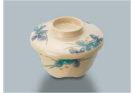
MB-51 MDS(水無月草) 深小鉢蓋