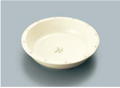
▲MS-341 HMR(華かんむり) 丸深皿 A 140 × 36 ・ 260ml ¥1,000 C-140 ¥340 → P.303