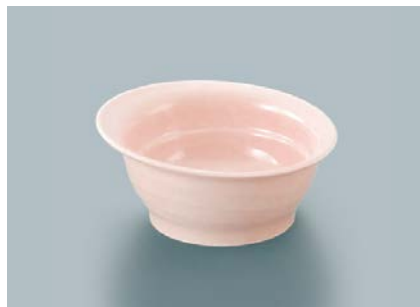
UMB-478 SAK(桜)傾斜丸小鉢 105 × 49 ・ 140ml ¥620 POINT すべり止め加工付もあります。(→P.255)