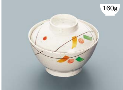
160g MB-609 SER(セリーン) 飯椀蓋 111 × 35 ¥560 MB-608 SER(セリーン) 飯椀 AB 120 × 64 ① 92・400ml ¥900