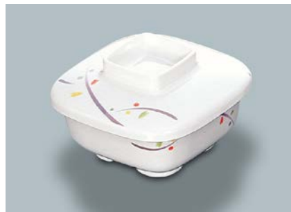
MB-614 LNA(ルナデコール) 角小鉢蓋