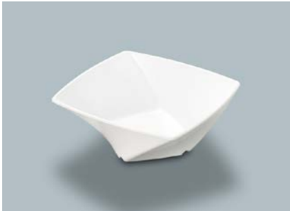
MB-680 W(ホワイト) ツイストボール A 110 × 110 × 45 ・ 230ml ¥710