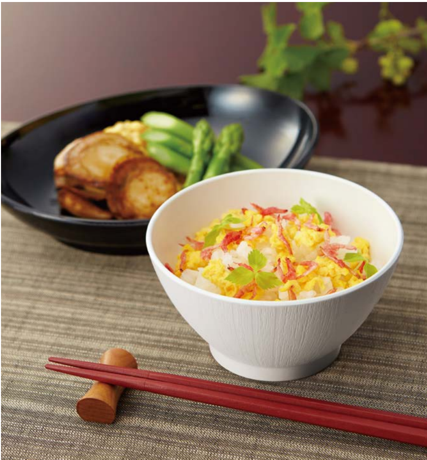
使用食器 | MB-896 W ライスボール(スリム)、MS-848 BK オーバル皿、TH-220S R PBT箸