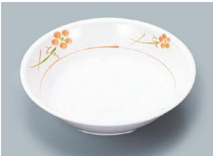
MS-2120 YUK (友花) カレー皿 198 × 43 ・ 720ml ¥1,170 ☎ C-200 ¥470 → P.302