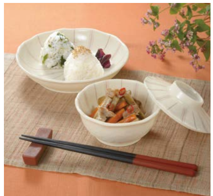
MB-927 TKU・MB-926 TKU 小鉢、 使用食器 MS-952 TKU 深皿、YB-260 TI 箸置き、 TH-220S KTS PBT塗り箸