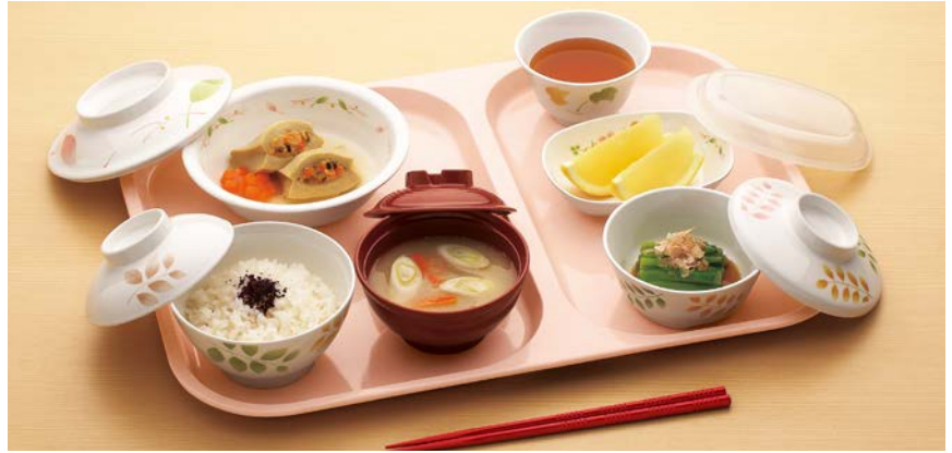
使用食器 | MB-609 HNE・MB-608 HNE 飯椀、UMF-403 TUS・UMB-402 TUS 安定型汁椀、MB-516 HNE・MB-515 HNE 丸鉢、MB-51 HNE・MB-50 HNE 小鉢、C-1411 W・MB-637 HNE 小判小鉢、MC-13 HNE 湯呑、TH-220X R PBT箸