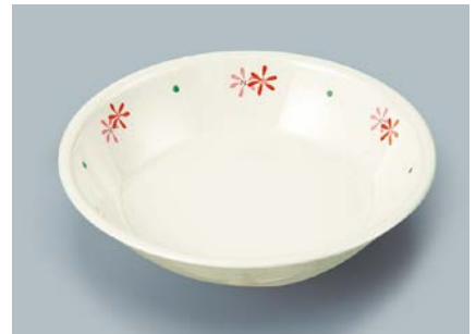
MS-2120 HKK (花ころも) カレー皿 198 × 43 ・ 720ml ¥1,180 ☎ C-200 ¥470 → P.302