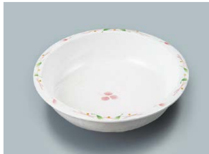
MS-343 HNE(葉音) 丸深皿 A 165 × 40 ・ 430ml ¥1,140

☞ C-170 ¥430 → P.302 ☞ P-203 ¥400 → P.303