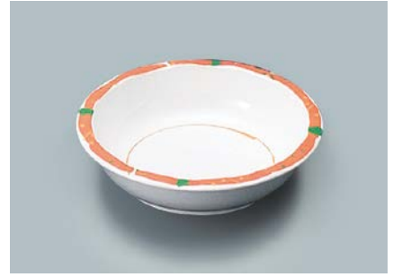
MS-341 F(ふる里) 丸深皿 A 140 × 36 ・ 260ml ¥980 C-140 ¥340 → P.303