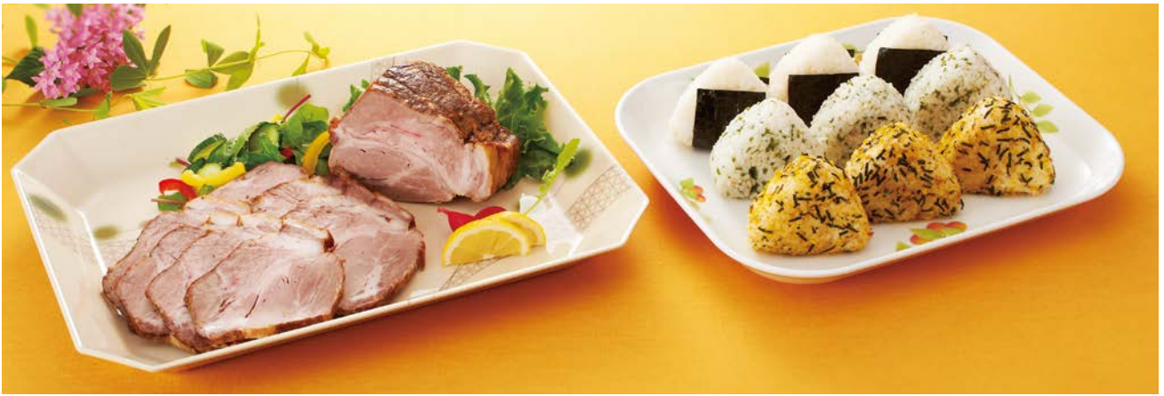
使用食器 | D-1015 EMOR デリカバット、M-253 KNM デリカバット