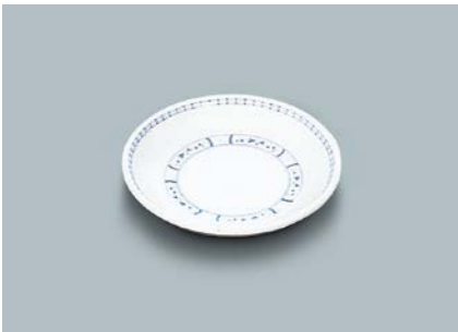
MS-648 BOD(ボルドー)和皿 100 × 19 ¥550