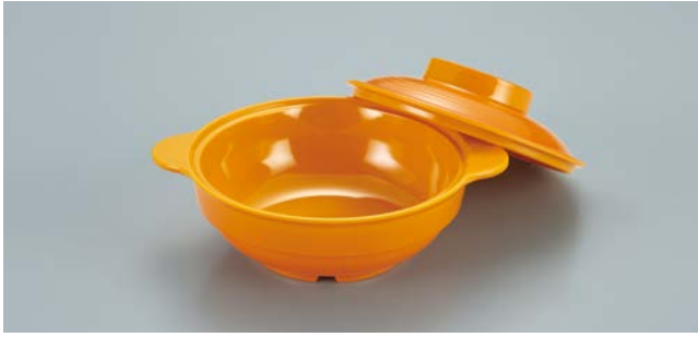
MB-85 RO (ルージュオレンジ) スープボール蓋