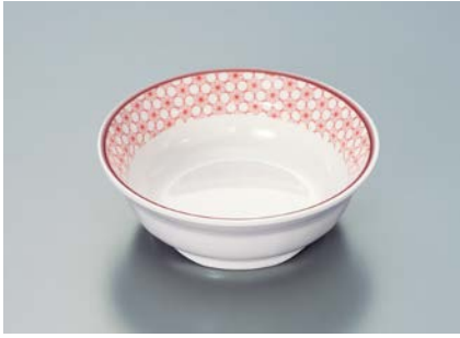
MB-634 EMAS (麻の葉)小鉢 115 × 39 ・ 210ml ¥820