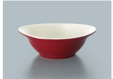
MB-816 RUW(赤内白) マルチボール AB 165 × 137 × 55 ・ 410ml ¥1,270