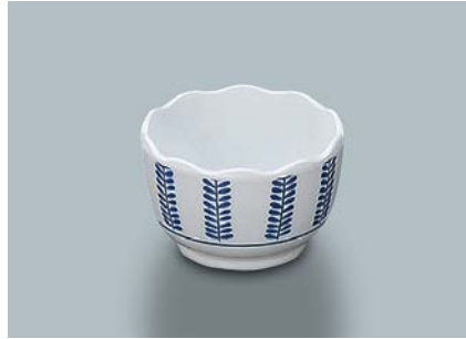
MB-812 F(ふる里) 波瀾小付 70 × 45 ・ 100ml ¥670