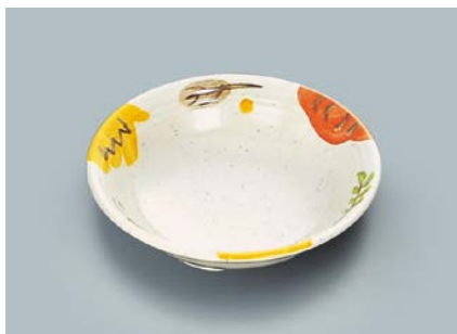
MS-564 CAR(カリブ) ベリー皿 140 × 35 ・ 280ml ¥760 ☞ C-140 ¥340 → P.303