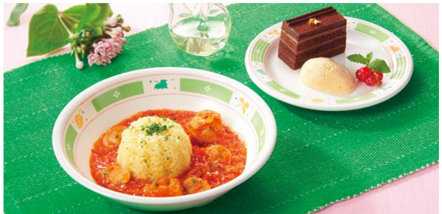
使用食器 | MS-2120 GG カレー皿、MS-526 GG パン皿