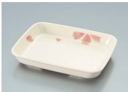
MS-870 EMBS(ぼかし桜) 角皿 AB 157 × 120 × 27・280ml ¥1,050