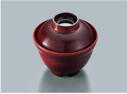
MB-791 TUS(溜内朱) はげ目汁椀蓋 96 × 38 ¥460