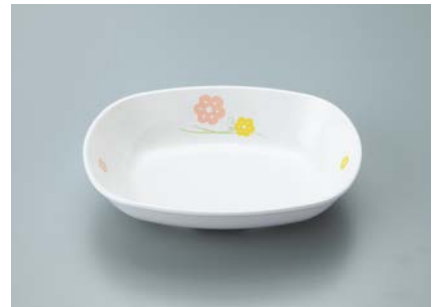
MB-637 KAK (かくれんぼ)小判小鉢 AB 133 × 100 × 31 ・ 180ml ¥850 C-1411 ¥400 → P.307