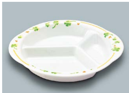
MS-879 HPY(ハッピー) ミツ仕切皿