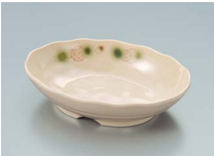
MS-560 EMOR (織部) 小判皿 AB 170 × 123 × 40 ・ 350ml ¥1,370 P-209 ¥450 → P.307