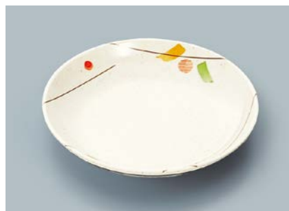
MS-662 SER(セリーン) 菜皿 AB