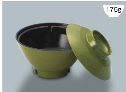
175g MB-903 MTA (抹茶) 飯椀蓋

POINT ①内側コーティングなので、ご飯がこびりつきにくい飯椀です。 ②ご飯の白さが引き立つカラー。