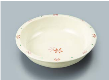
MS-343 HKK(花ころも) 丸深皿 A 165 × 40 ・ 430ml ¥1,140

☞ C-170 ¥430 → P.302 ☞ P-203 ¥400 → P.303