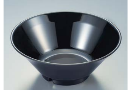
MB-705 BK (黒) タンメン鉢 AB 195 × 77 ・ 1,000ml ¥1,360 C-200 ¥470 → P.302