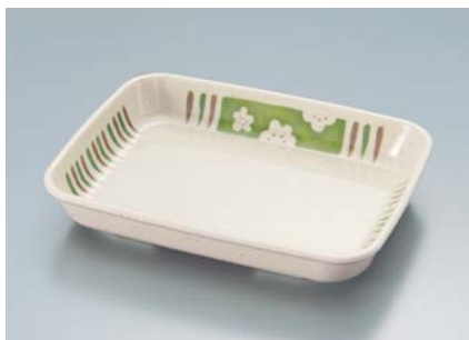
MS-870 EMUT(梅十草) 角皿 AB 157 × 120 × 27・280ml ¥1,050