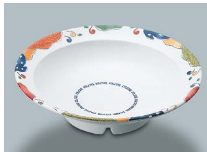
MS-715 BAN(万里) 高台鉢 AB 214 × 56 ¥1,660