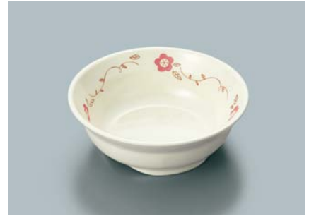
MB-634 HKZ (ひめかずら)小鉢 115 × 39 ・ 210ml ¥800