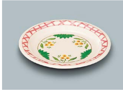
MS-522 DL(デル・レッタ) パン皿 165 × 17 ¥860

☞ C-170 ¥430 → P.302 ☞ P-203 ¥400 → P.303