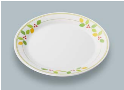
新 MS-150 NNA(ニーナ) パン皿 AB 170 × 17 ¥980 C-170 ¥430 → P.302