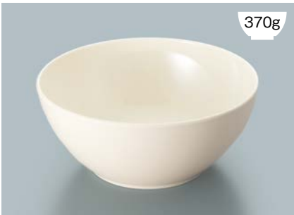
MB-826 V(ベージュ)フリーボール AB