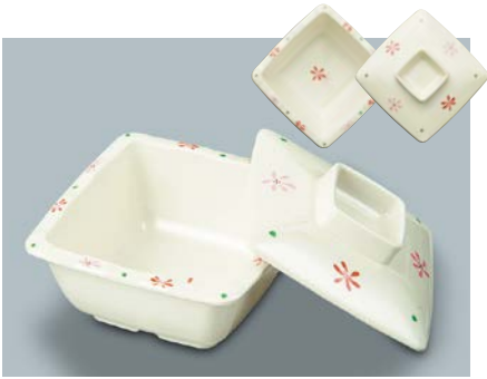
MB-337 HKK(花こころ)角小鉢蓋