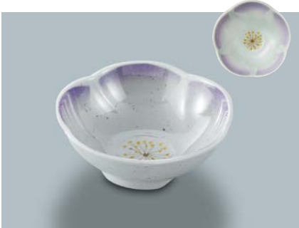
MB-769 UMA (梅の花 青) 梅小鉢 99 × 34 ・ 120ml ¥670