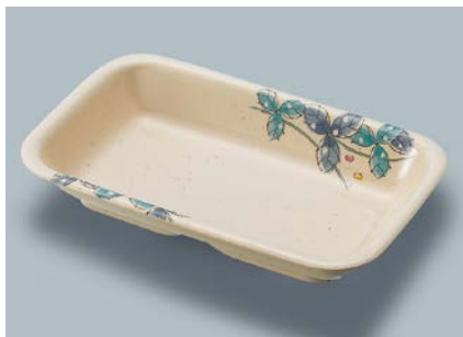
MS-555 MDS(水無月草) 角深皿