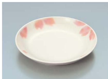
MS-662 EMBS(ぼかし桜) 菜皿 AB