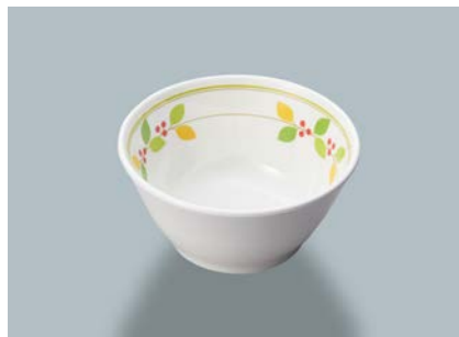
新 MB-276 NNA(ニーナ) フリーカップ AB