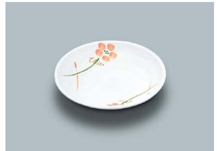
MS-649 YUK(友花) 和皿 120 × 20 ¥640