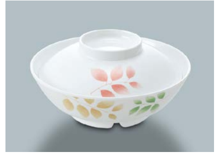
MB-604 HNE(葉音) 煮物椀蓋

MB-675 MDS(水無月草) 煮物椀 AB 160 × 52 ①77・520ml ¥1,280