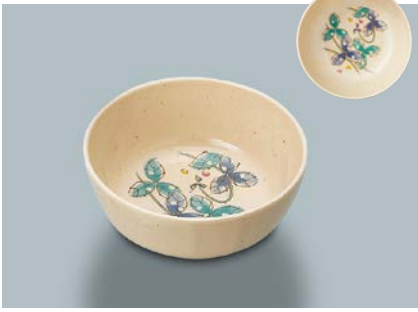
MB-647 MDS(水無月草) 丸小鉢 110 × 45 ・ 270ml ¥690