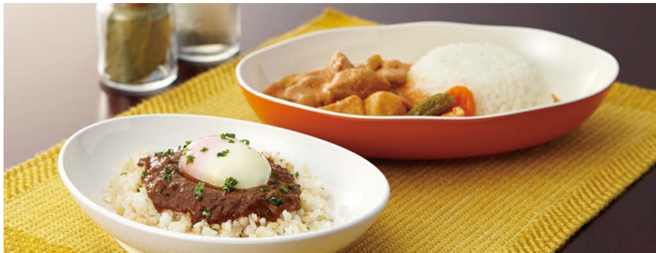
使用食器 | MS-848 W オーバル皿、MS-846 OUV オーバル皿