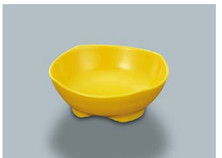
MB-616 Y(イエロー)小鉢 AB