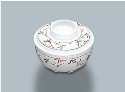
MB-375 F (ふる里) 丸小鉢蓋 102 × 28 ¥740