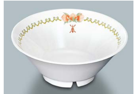
MB-705 CN (中華) タンメン鉢 AB 195 × 77 ・ 1,000ml ¥1,440 C-200 ¥470 → P.302