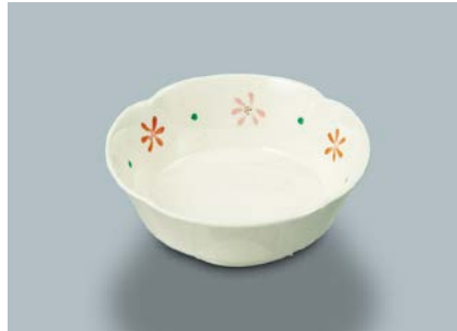
MB-620 HKK(花ころも)丸小鉢 AB 110×40・180ml ¥850 C-110 ¥330→P.303