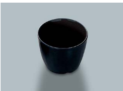
MC-735 BK(黒) つゆ入れ 86 × 67・230ml ¥520