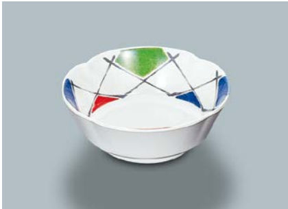
MB-620 FA(ふる里)丸小鉢 AB 110×40・180ml ¥790 C-110 ¥330→P.303