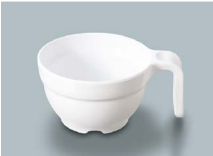
MC-80 SW (白雪) スープカップ AB