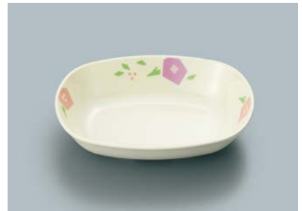
MB-637 HMR (華かんむり)小判小鉢 AB 133 × 100 × 31 ・ 180ml ¥830 C-1411 ¥400 → P.307