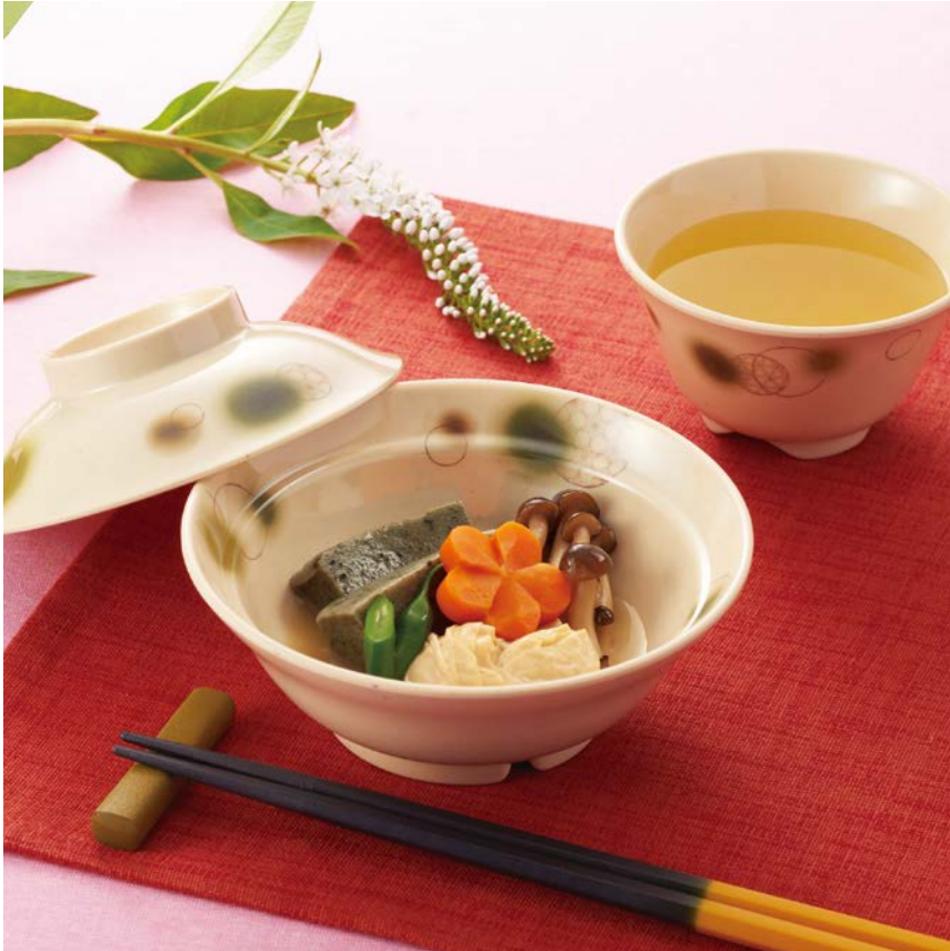
使用食器 | MB-607 EMOR・MB-673 EMOR 煮物椀、MC-13 EMOR 湯呑、TH-220S KTK PBT塗り箸