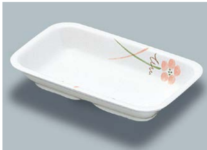
MS-555 YUK(友花) 角深皿