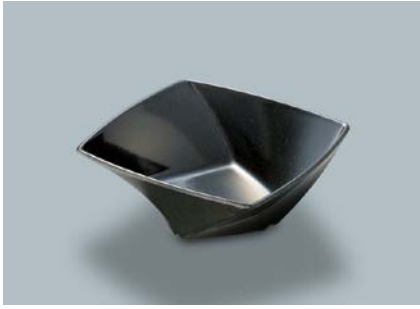
MB-680 KMT(黒マット) ツイストボール A 110 × 110 × 45 ・ 230ml ¥710