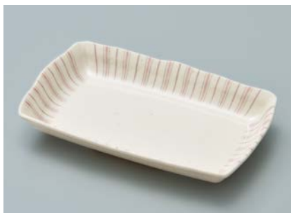
MS-958 TKU(十草) 長角皿 AB

使用食器 | MS-958 TKU 長角皿、MB-917 TKU ・ MB-916 TKU 角小鉢、TH-220S KTA PBT塗り箸