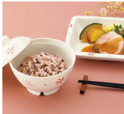
使用食器 | MB-609 HKK・MB-608 HKK 飯椀、MS-347 HKK 角皿、TH-210SN BK PBT箸