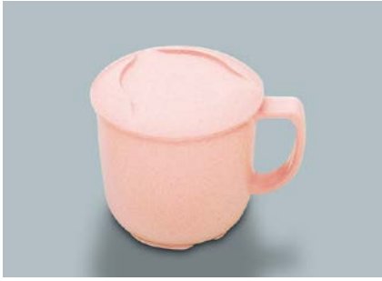
MC-116 P(ピンク) マグカップ蓋 86 × 17 ¥330 MC-16 P(ピンク) マグカップ 104 × 80 × 73 ①82・270ml ¥690