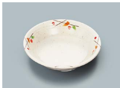
MS-564 SER(セリーン) ベリー皿 140 × 35 ・ 280ml ¥760 ☞ C-140 ¥340 → P.303