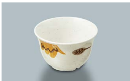
MC-12 CAR(カリブ) 湯呑 95 × 58 ・ 220ml ¥560