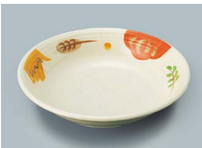
MS-566 CAR(カリブ) クープ皿 A