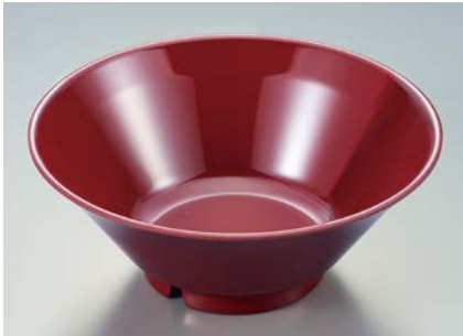
MB-705 R (赤) タンメン鉢 AB 195 × 77 ・ 1,000ml ¥1,360 C-200 ¥470 → P.302