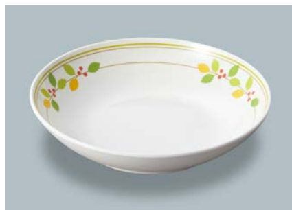
新 MS-248 NNA (ニーナ) 深皿 AB 198 × 43 ・ 780ml ¥1,350 C-200 ¥470 → P.302

使用食器 | MS-150 CRM パン皿、MS-248 CMM 深皿、PC-80 DPM コップ、TAS-01 デザートスプーン、TAS-02 デザートフォーク