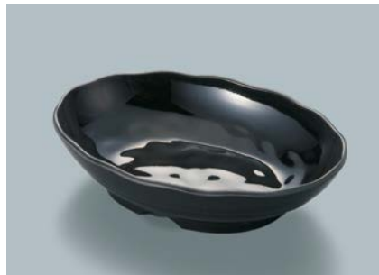
MS-560 KMT (黒マット) 小判皿 AB 170 × 123 × 40 ・ 350ml ¥1,090 P-209 ¥450 → P.307