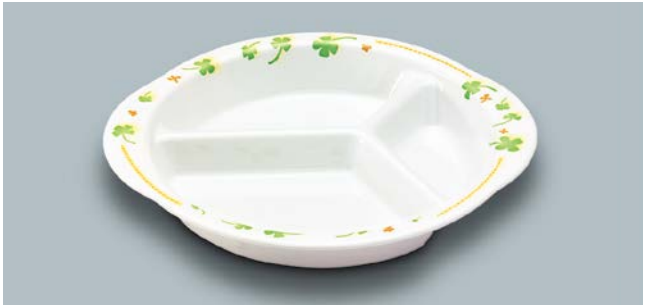
MS-878 HPY(ハッピー) ミツ仕切皿