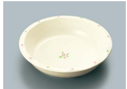
MS-343 HMR(華かんむり) 丸深皿 A 165 × 40 ・ 430ml ¥1,140

☞ C-170 ¥430 → P.302 ☞ P-203 ¥400 → P.303