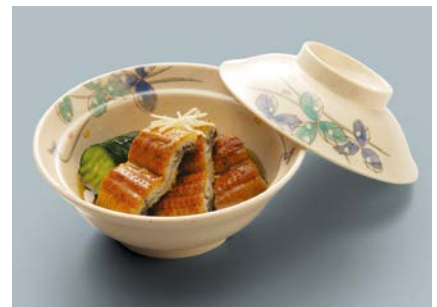
使用食器 | MB-607 MDS 煮物椀蓋、MB-673 MDS 煮物椀