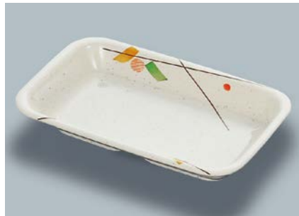
MS-555 SER(セリーン) 角深皿