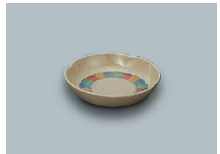
MS-530 F(ふる里)小皿 95 × 20 ¥500