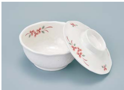
MB-923 AEK(赤絵小花)小鉢蓋 104 × 29 ¥710

MB-922 AEK(赤絵小花)小鉢 AB 100 × 40 ①63 ・ 160ml ¥890