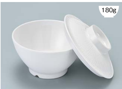
MB-897 W(ホワイト) ライスボール蓋 128 × 36 ¥650

POINT ①内側コーティングなので、ご飯がこびりつきにくい飯椀です。 ②ご飯の白さが引き立つカラー。