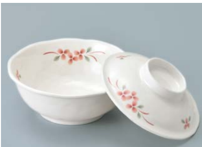
MB-963 AEK(赤絵小花) 煮物椀蓋 120 × 32 ¥900