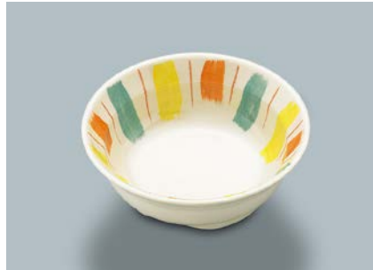
MB-634 FA (ふる里)小鉢 115 × 39 ・ 210ml ¥790