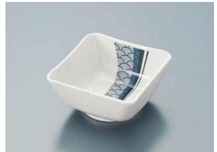
MB-686 EMSG(青海波)四角小鉢 AB 89 × 89 × 44 ・ 180ml ¥850 C-1010 ¥320 → P.306