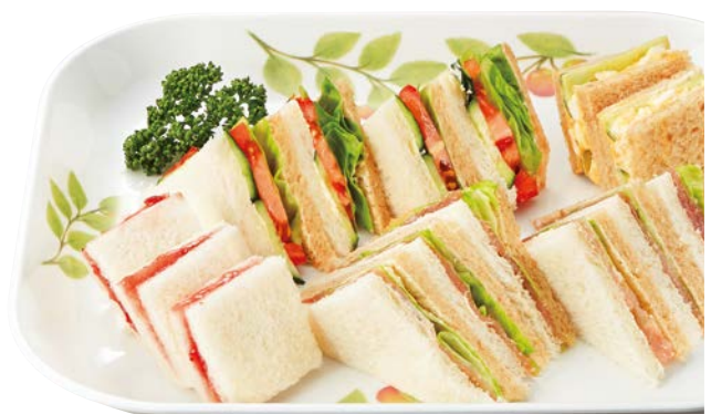
使用食器 | M-253 KNM デリカバット