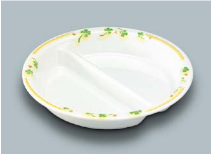
MS-876 HPY (ハッピー) ニツ仕切皿 200 × 34 ¥1,640