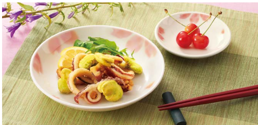
使用食器 | MS-662 EMBS 菜皿、MS-648 EMBS 和皿、TH-220S R PBT箸