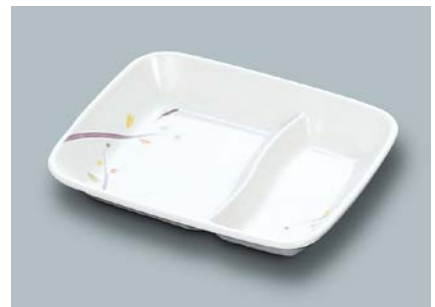
MS-875 LNA (ルナデコール) ニツ仕切角皿 155 × 117 × 26 ¥1,010