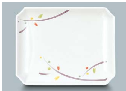
MS-647 LNA (ルナデコール) 角皿 AB 175 × 135 × 21 ¥1,070