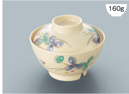
160g MB-609 MDS(水無月草) 飯椀蓋 111 × 35 ¥640 MB-608 MDS(水無月草) 飯椀 AB 120 × 64 ① 92・400ml ¥980