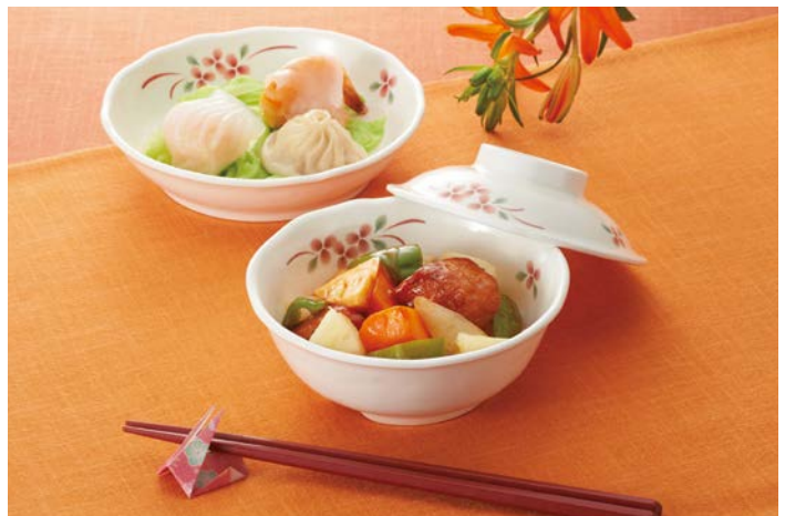
使用食器 | MB-963 AEK・MB-962 AEK 煮物椀、MS-950 AEK 深皿、TH-220S R PBT 箸