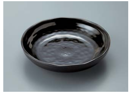
MS-766 KMT(黒マット) 深皿 AB 160 × 39 ・ 400ml ¥930 P-203 ¥400 → P.303