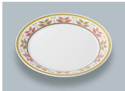
新 MS-150 CRM(カルメラ) パン皿 AB 170 × 17 ¥980 C-170 ¥430 → P.302