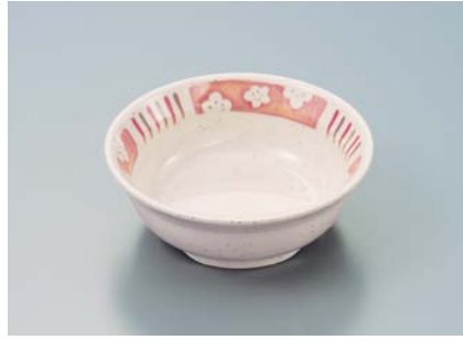
MB-632 EMUTP(梅十草)小鉢 105 × 37 ・ 160ml ¥740 C-106 ¥330 → P.304