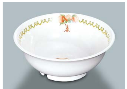
MB-701 CN(中華) ラーメン丼 AB 203 × 78 ・ 1,350ml ¥1,510