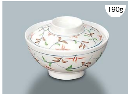
190g MB-577 FA (ふる里) 飯椀蓋

MB-576 F (ふる里) 飯椀 AB 134 × 66 ① 87 · 470ml ¥970