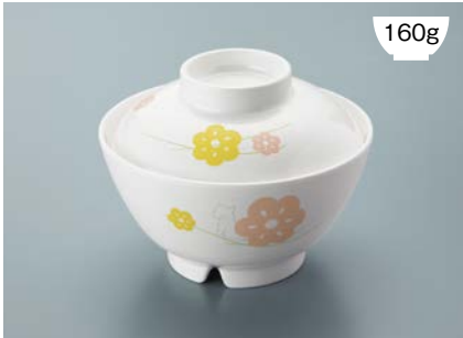
160g MB-609 KAK(かくれんぼ) 飯椀蓋 111 × 35 ¥660 MB-608 KAK(かくれんぼ) 飯椀 AB 120 × 64 ① 92・400ml ¥1,000