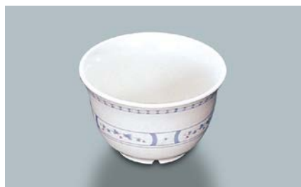
MC-12 BOD(ボルドー) 湯呑 95 × 58 ・ 220ml ¥550