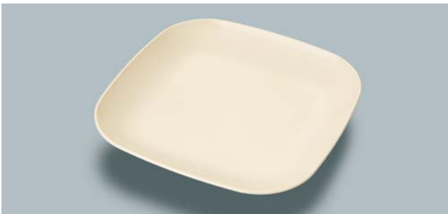
MS-844 V(ベージュ) フリープレート AB 230 × 230 × 30 ¥1,670 W-2323 ¥430 → P.307