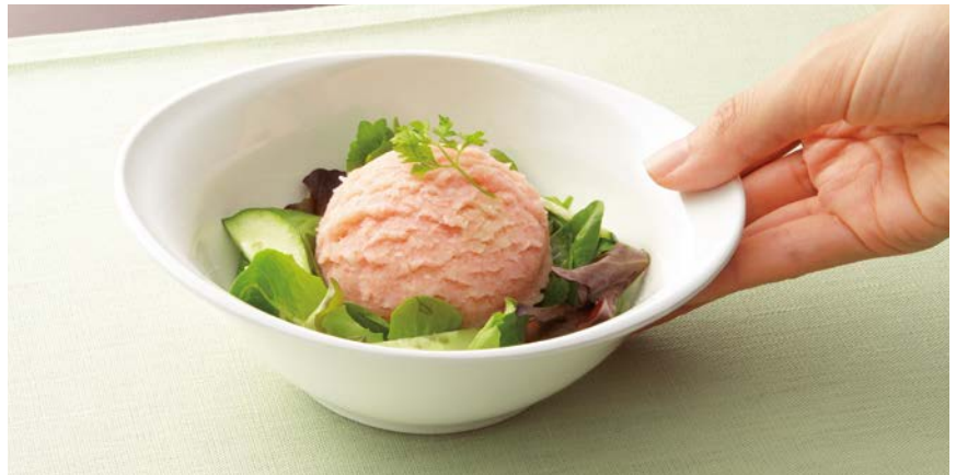
使用食器 | MB-816 W マルチボール