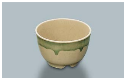
MC-34 F(ふる里) 湯呑 92 × 58 ・ 220ml ¥570