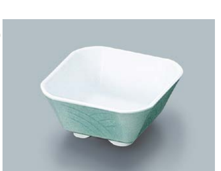
MB-611 F(ふる里)角小鉢 AB