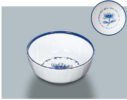
MB-647 FA(ふる里) 丸小鉢 110 × 45 ・ 270ml ¥670