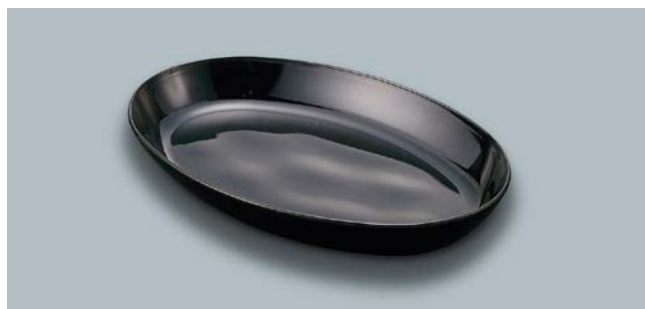
MS-836 KMT(黒マット) 楕円皿 AB 240 × 155 × 35 ・ 660ml ¥1,140