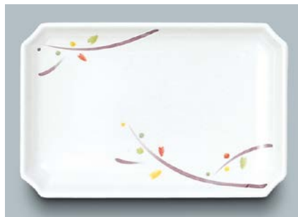
MS-545 LNA(ルナデコール) 角皿 AB