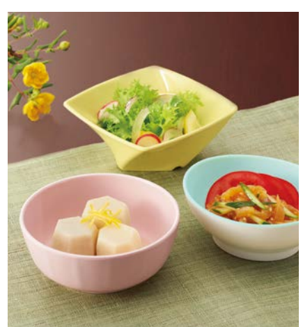
使用食器 | MB-647 SAK 丸小鉢、MB-680 LMY ツイストボール、 MB-630 MMD リップボール