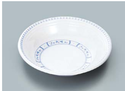
MS-565 BOD(ボルドー) ケーブ皿 A 165 × 40 ・ 420ml ¥900

☞ C-170 ¥430 → P.302 ☞ P-203 ¥400 → P.303