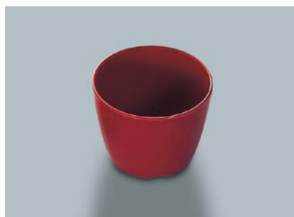
MC-735 R(赤) つゆ入れ 86 × 67・230ml ¥520