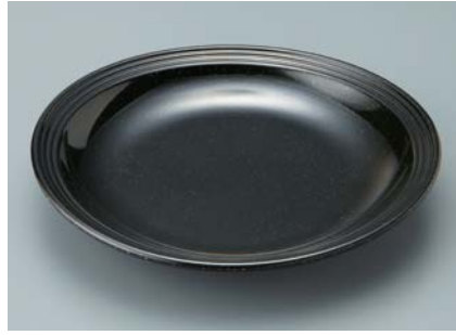
MS-842 KMT (黒マット) かぶと皿 AB 210 × 34 ・ 520ml ¥1,250 ☎ W-210 ¥370 → P.307