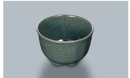
MC-14 WT(技) 湯呑 86 × 55 ・ 190ml ¥410