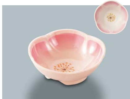
MB-769 UME (梅の花 ピンク) 梅小鉢 99 × 34 ・ 120ml ¥670