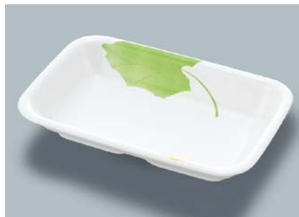
MS-555 HNE(葉音) 角深皿