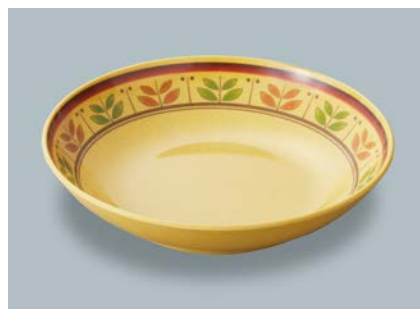
新 MS-248 CMM (カルメラマスタード) 深皿 AB 198 × 43 ・ 780ml ¥1,390 C-200 ¥470 → P.302