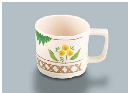
MC-18 DL(デル・レッタ) マグカップ 107 × 80 × 70・250ml ¥950 ① P-204 ¥330 → P.304