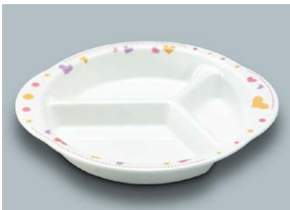
MS-879 HRT(ハート) ミツ仕切皿