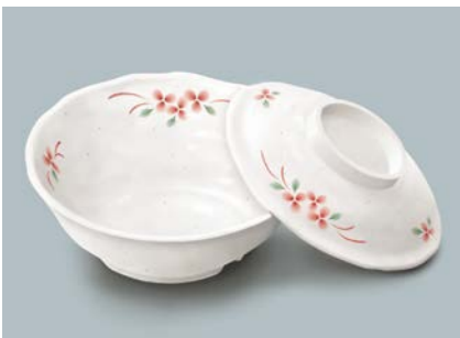
MB-965 AEK(赤絵小花) 煮物椀蓋