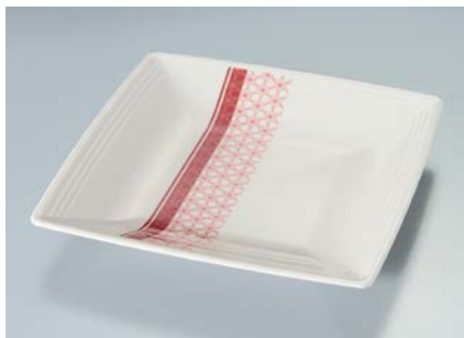
MS-838 EMAS(麻の葉) スクエアプレート A 160 × 160 × 24 ¥1,180