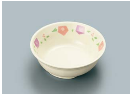
▲MB-632 HMR(華かんむり)小鉢 105 × 37 ・ 160ml ¥740 C-106 ¥330 → P.304