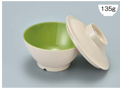
135g MB-905 CS(クリームストーン) ライスボール蓋 121 × 36 ¥560