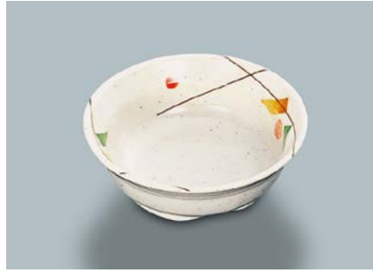
MB-634 SER (セリーン)小鉢 115 × 39 ・ 210ml ¥740