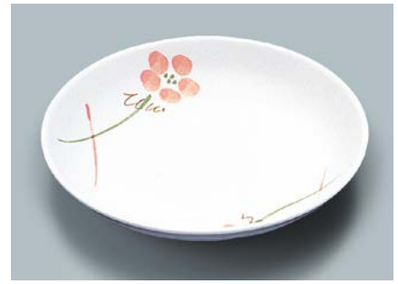
MS-665 YUK(友花) 菜皿 AB 190 × 30 ¥980 C-190 ¥440 → P.302