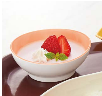
使用食器 | MB-630 VAL リップボール

POINT 一つひとつの風合いが異なる陶磁器の釉をかけたようなグラデーションです。