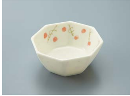
MB-688 FB (ふる里) 八角小鉢 A 89 × 89 × 40 ・ 130ml ¥820