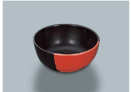
MB-647 WS(技) 丸小鉢 110 × 45 ・ 270ml ¥550