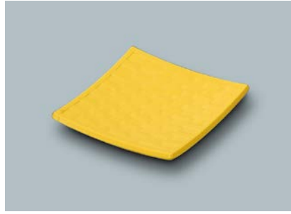
M-104 Y(ふる里) 平角皿 A 109 × 109 × 15 ¥690