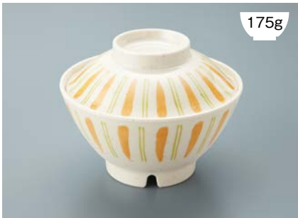
175g MB-607 FC (ふる里) 飯椀蓋