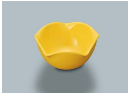
G-795 Y (イエロー) 小付 85 × 42 ・ 105ml ¥480