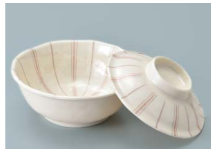
MB-963 TKU(十草) 煮物椀蓋 120 × 32 ¥900