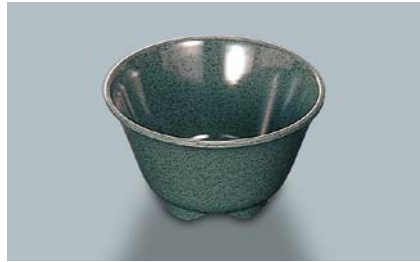
MC-13 WT(技) 湯呑 AB 97 × 55 ・ 200ml ¥430