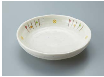
MS-766 ISN(いさ野) 深皿 AB 160 × 39 ・ 400ml ¥1,520 P-203 ¥400 → P.303