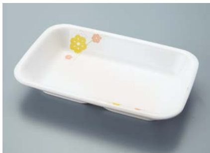
▲ MS-555 KAK(かくれんぼ) 角深皿