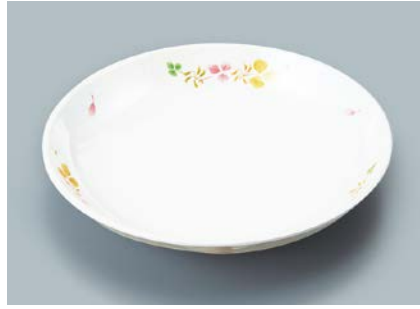
MS-664 HNE(葉音) 菜皿 AB 180 × 30 ¥900 C-180 ¥430 → P.302