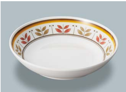
新 MS-246 CRM(カルメラ) 深皿 AB 180 × 40 ・ 600ml ¥1,190 C-180 ¥430 → P.302