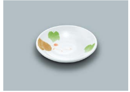
MS-648 HNE(葉音)和皿 100 × 19 ¥600