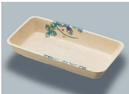
MS-553 MDS(水無月草) 角深皿 AB