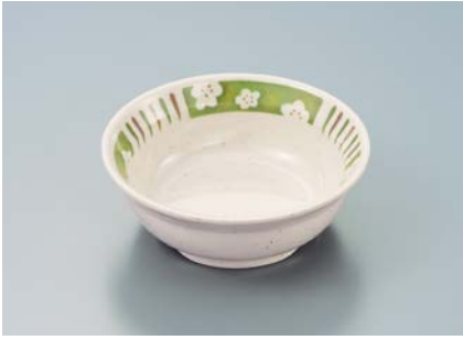
MB-632 EMUTG(梅十草)小鉢 105 × 37 ・ 160ml ¥740 C-106 ¥330 → P.304