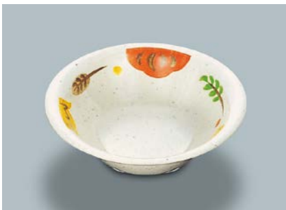
MB-513 CAR(カリブ) サラダボール