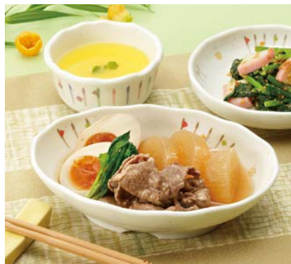
使用食器 | MS-560 ISN 小判皿、MB-621 ISN 丸小鉢、MS-763 ISN 取り皿