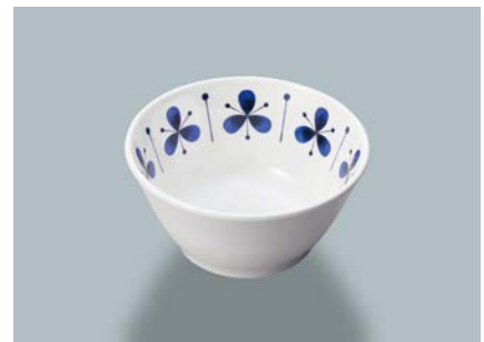
新 MB-276 PIT(ピアット) フリーカップ AB