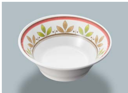
新 MB-180 CRM(カルメラ) サラダボール AB 130 × 46 ・ 280ml ¥970 ☞ P-206 ¥380 → P.303