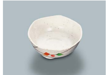
MB-676 SER(セリーン) 小付 AB 84 × 34 ・ 90ml ¥530