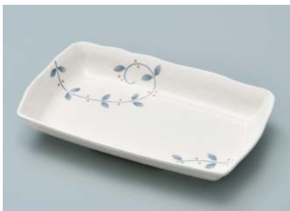
MS-958 NTK(南天唐草) 長角皿 AB