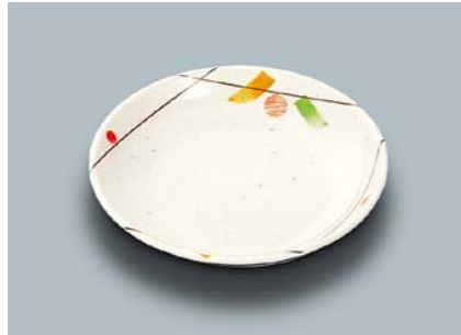
MS-661 SER(セリーン) 菜皿 AB 140 × 26 ¥740 C-140 ¥340 → P.303