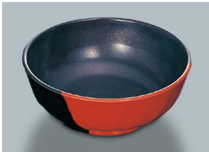
MB-599 WS(技) 麵鉢 AB 200 × 77 ・ 1,400ml ¥1,600 C-200 ¥470 → P.302