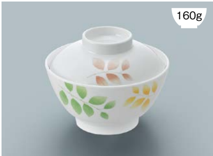
160g MB-609 HNE(葉音) 飯椀蓋 111 × 35 ¥610 MB-608 HNE(葉音) 飯椀 AB 120 × 64 ① 92・400ml ¥920