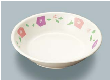
▲MS-2120 HMR (華かんむり) カレー皿 198 × 43 ・ 720ml ¥1,180 ☎ C-200 ¥470 → P.302