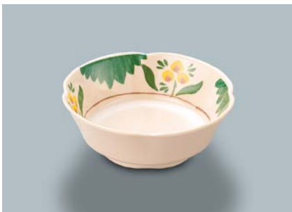
MB-620 DL(デル・レッタ)丸小鉢 AB 110×40・180ml ¥810 C-110 ¥330→P.303