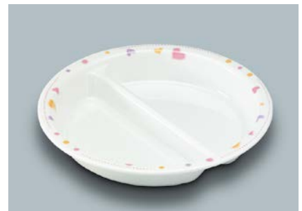
MS-876 HRT(ハート) ミツ仕切皿