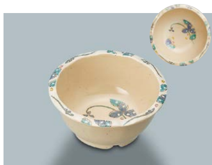
MB-333 MDS(水無月草) 丸小鉢 116 × 53 ・ 280ml ¥970 ☞ C-110 ¥330 → P.303