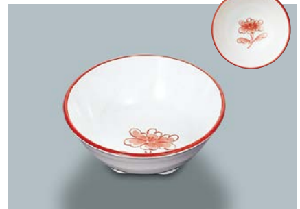
MB-650 FB (ふる里)天水 110 × 43 ・ 200ml ¥690