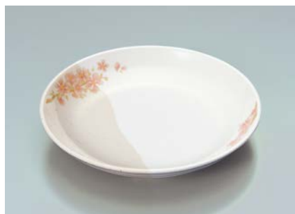
MS-662 EMSK(桜) 菜皿 AB