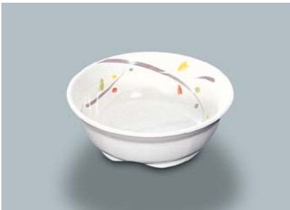
MB-632 LNA(ルナデコール)小鉢 105 × 37 ・ 160ml ¥700 C-106 ¥330 → P.304