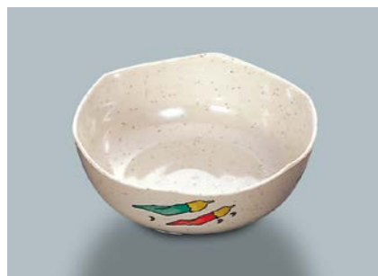
MB-678 FA(ふる里) 刺身鉢 AB 148 × 55・540ml ¥1,090