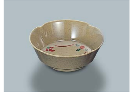
MB-620 F(ふる里)丸小鉢 AB 110×40・180ml ¥750 C-110 ¥330→P.303