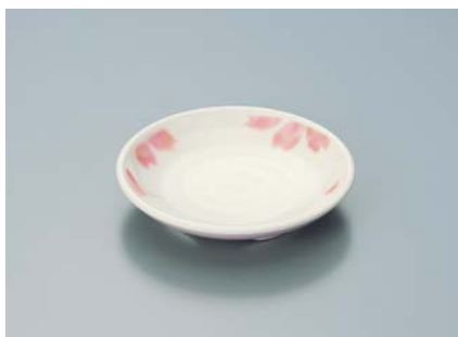
MS-648 EMBS(ぼかし桜) 和皿 100 × 19 ¥630