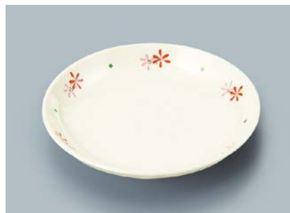
MS-662 HKK(花ころ) 菜皿 AB