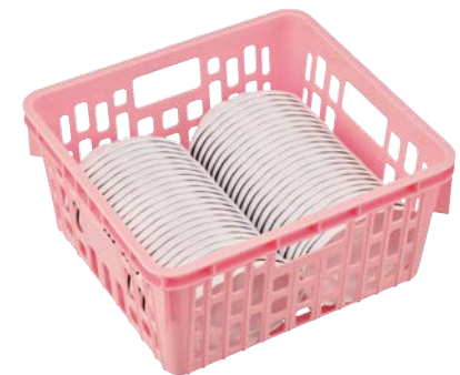
PSK-300N の使用例 メラミンウェア 小判皿 (MS-560 W) × 46枚 → 334 PAGE