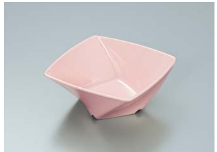
MB-680 SAK(桜) ツイストボール A 110 × 110 × 45 ・ 230ml ¥710