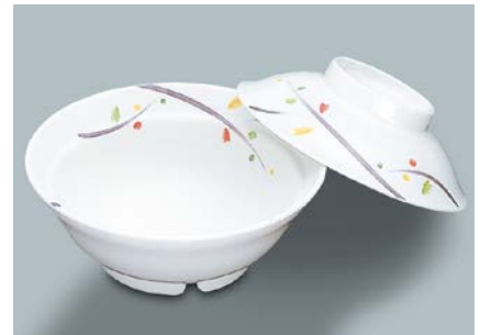
MB-607 LNA(ルナデコール) 煮物椀蓋