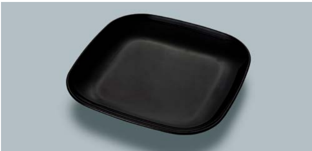
MS-844 BK(黒) フリープレート AB 230 × 230 × 30 ¥1,670 W-2323 ¥430 → P.307