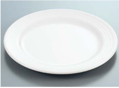
MS-528 W (ホワイト) ミート皿 230 × 20 ¥1,170 ☎ 195-OP ¥300 → P.307