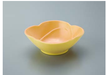
MB-690 FA (ふる里) 花卉小鉢 90 × 33 ・ 100ml ¥660

POINT 一つひとつの風合いが異なる陶磁器の釉をかけたようなグラデーションです。