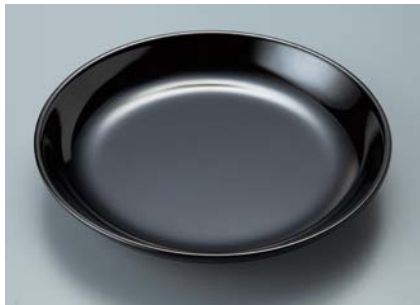
MS-665 BK(黒) 菜皿 AB 190 × 30 ¥750 C-190 ¥440 → P.302

使用食器 MS-665 BK 菜皿、P-15 V すのこ、MS-872 KMT 角皿、MS-648 R 和皿、MC-735 R つゆ入れ、TH-220X VUK PBT塗り箸