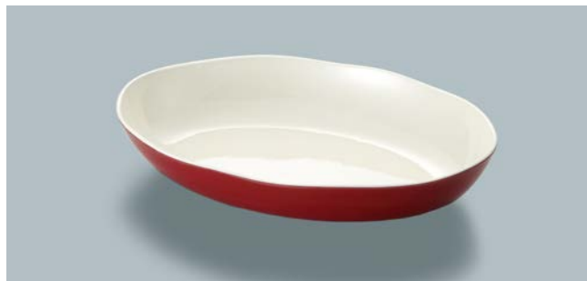
MS-846 RUW(赤内白) オーバル皿 AB 250 × 170 × 68 ・ 900ml ¥1,690