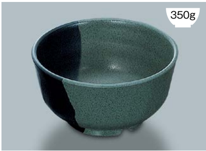
MB-593 WF (技) 多用丼 AB 150 × 78 ・ 780ml ¥1,070 P-202 ¥380 → P.303 P-207 ¥420 → P.303 71S ¥860 → P.308