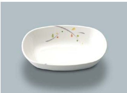
MB-637 LNA (ルナデコール)小判小鉢 AB 133 × 100 × 31 ・ 180ml ¥790 C-1411 ¥400 → P.307