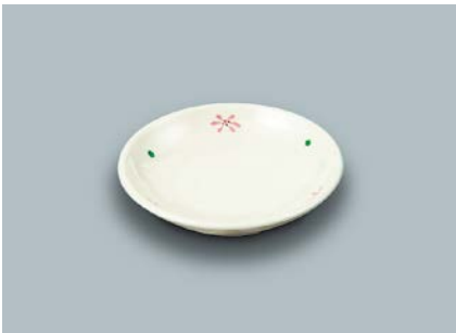
MS-648 HKK(花ころ)和皿 100 × 19 ¥630