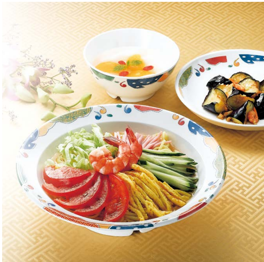
使用食器 | MS-715 BAN 高台鉢、MS-662 BAN 菜皿、MB-2 BAN 汁椀