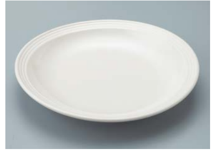
MS-842 SW (白雪) かぶと皿 AB 210 × 34 ・ 520ml ¥1,250 ☎ W-210 ¥370 → P.307