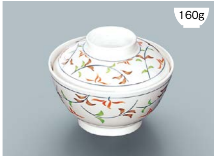
160g MB-609 F(ふる里) 飯椀蓋 111 × 35 ¥590 MB-608 F(ふる里) 飯椀 AB 120 × 64 ① 92・400ml ¥930