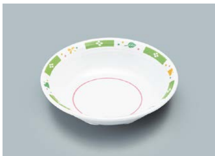
MS-564 GG(グリーンガラス) ベリー皿 140 × 35 ・ 280ml ¥800 ☞ C-140 ¥340 → P.303