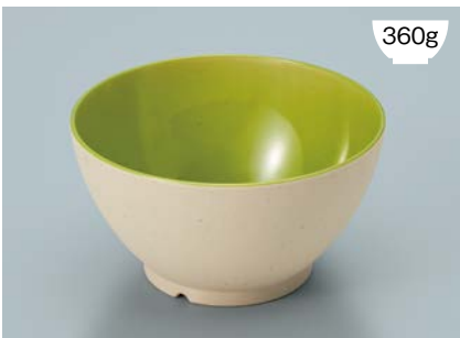
MB-908 CSUG(クリームストーン内緑)ライスボール(スリム) AB