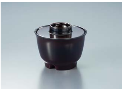
MB-77 TUK(溜内黒) 汁椀蓋 86 × 19 ¥490