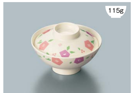
115g ▲ MB-804 HMR(華かんむり) 飯茶椀蓋 107 × 30 ¥620