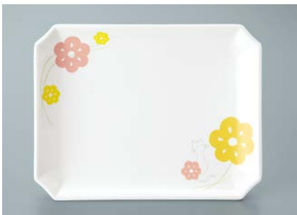
▲ MS-647 KAK (かくれんぼ) 角皿 AB 175 × 135 × 21 ¥1,110