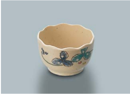
MB-812 MDS(水無月草) 波瀾小付 70 × 45 ・ 100ml ¥710