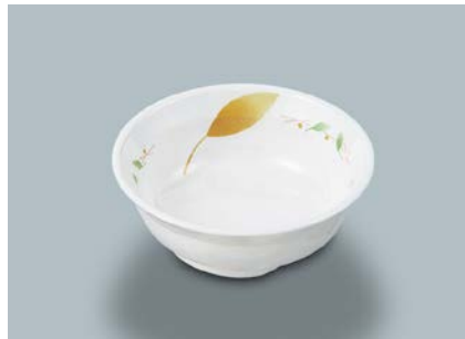
MB-632 HNE(葉音)小鉢 105 × 37 ・ 160ml ¥740 C-106 ¥330 → P.304