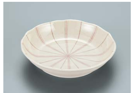
MS-952 TKU(十草) 深皿 AB 165 × 36 ・ 420ml ¥1,270

☞ C-170 ¥430 → P.302 ☞ P-203 ¥400 → P.303