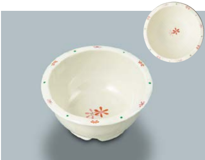
MB-331 HKK(花ころも)丸小鉢 100 × 46 ・ 180ml ¥930 C-101 ¥330 → P.304