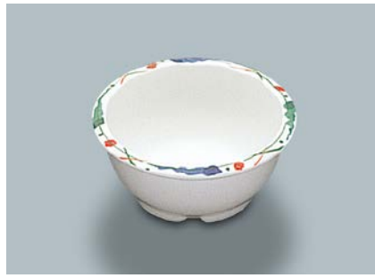
MB-331 F(ふる里)丸小鉢 100 × 46 ・ 180ml ¥790 C-101 ¥330 → P.304