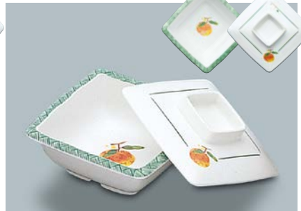
MB-339 F(ふる里) 角小鉢蓋 104 × 104 × 27 ¥780

MB-338 NAM(夏目) 角小鉢 A 110 × 110 × 40 ①64・220ml ¥930