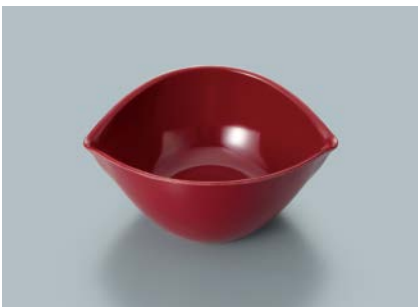
MB-850 R (赤) リーフボール AB 131 × 110 × 55・235ml ¥800