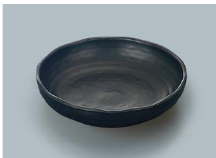
MS-765 KMT(黒マット) 深皿 AB 150 × 37 ・ 300ml ¥880 ☞ P-207 ¥420 → P.303