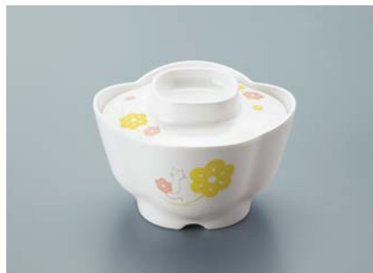
MB-371 KAK(かくれんぼ)花小鉢蓋 92 × 23 ¥630