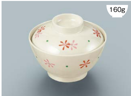
160g MB-609 HKK(花ころ) 飯椀蓋 111 × 35 ¥640 MB-608 HKK(花ころ) 飯椀 AB 120 × 64 ① 92・400ml ¥980