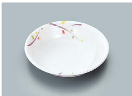
MS-564 LNA(ルナデコール) ベリー皿 140 × 35 ・ 280ml ¥780 ☞ C-140 ¥340 → P.303