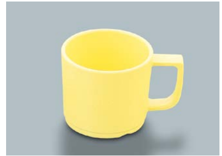
MC-18 Y(イエロー) マグカップ 107 × 80 × 70・250ml ¥740 ① P-204 ¥330 → P.304