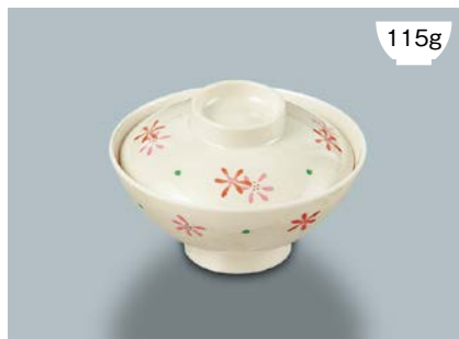
115g MB-804 HKK(花ころ) 飯茶椀蓋 107 × 30 ¥620