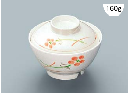
160g MB-609 YUK(友花) 飯椀蓋 111 × 35 ¥570 MB-608 YUK(友花) 飯椀 AB 120 × 64 ① 92・400ml ¥920