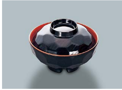
MB-220 KUS(黒内朱) 亀甲汁椀蓋 108 × 34 ¥360