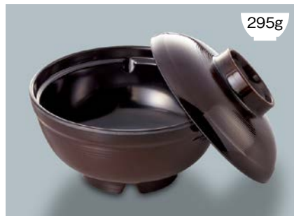
MB-787 TUK (溜内黒) 飯丼蓋 140 × 41 ¥760 MB-786 TUK (溜内黒) 飯丼 AB 150 × 76 ①105 ・ 740ml ¥1,090