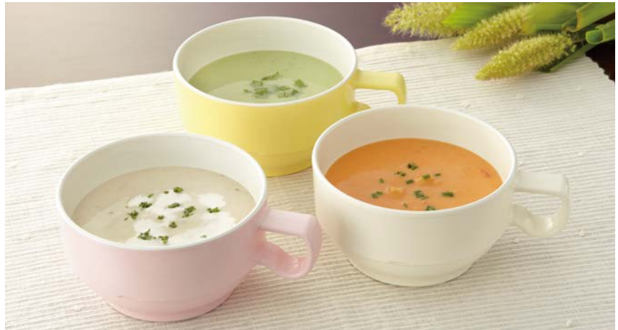
使用食器 | MC-82(SKUW・VUW・NNUW) スープカップ