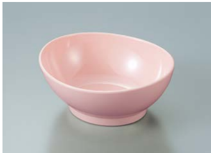
MB-630 P(ピンク)リップボール AB 110 × 95 × 45 ・ 165ml ¥890