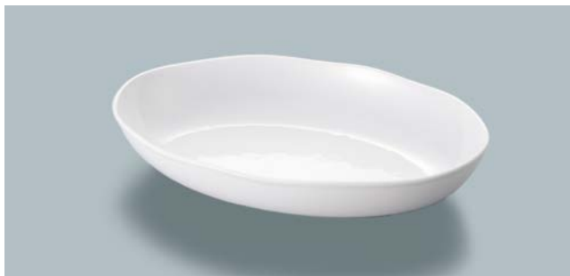
MS-846 W(ホワイト) オーバル皿 AB 250 × 170 × 68 ・ 900ml ¥1,690