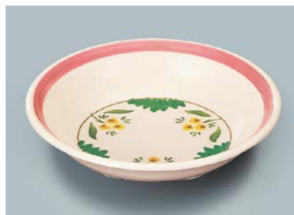
MS-566 DL(デル・レッタ) クープ皿 A