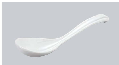
M-590 W (ホワイト) チリレンゲ