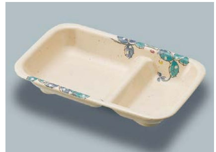
MS-558 MDS (水無月草) 角仕切皿 194 × 124 × 32 ¥1,210