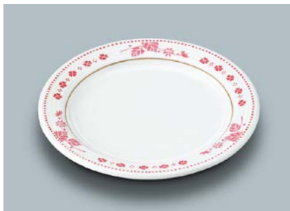
MS-526 SCR(スカーレット) パン皿 169 × 17 ¥860 C-170 ¥430 → P.302