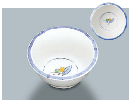
MB-333 NAM(夏目) 丸小鉢 116 × 53 ・ 280ml ¥890 ☞ C-110 ¥330 → P.303