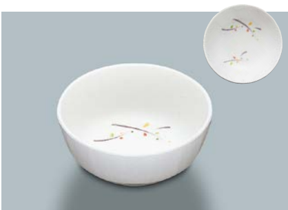
MB-647 LNA(ルナデコール) 丸小鉢 110 × 45 ・ 270ml ¥670