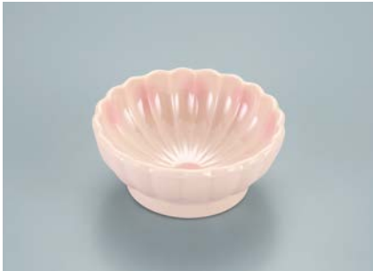
UMB-476 MU(無垢絵付) 菊花小鉢 85 × 35 ・ 90ml ¥930