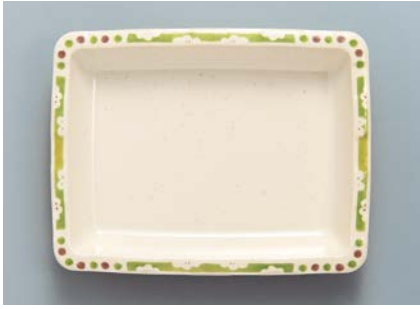
MS-347 EMUT (梅十草) 角皿 175 × 135 × 27 ・ 300ml ¥1,190