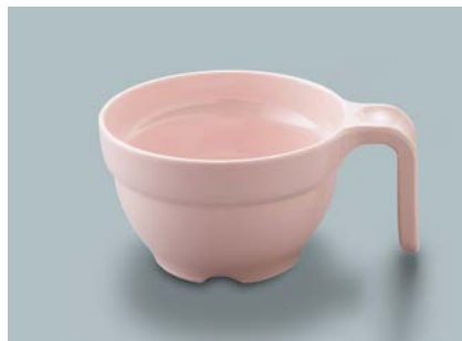
MC-80 SAK (桜) スープカップ AB