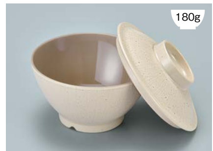
MB-897 CS(クリームストーン) ライスボール蓋 128 × 36 ¥650

POINT ①内側コーティングなので、ご飯がこびりつきにくい飯椀です。 ②ご飯の白さが引き立つカラー。