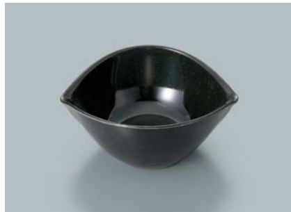
MB-850 KMT (黒マット) リーフボール AB 131 × 110 × 55・235ml ¥800