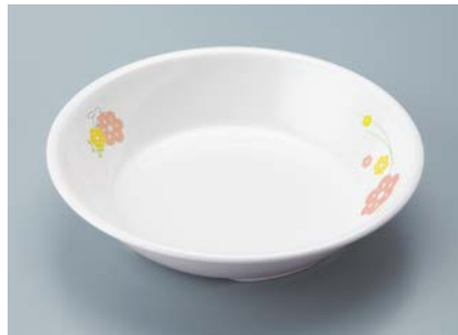
▲MS-2120 KAK (かくれんぼ) カレー皿 198 × 43 ・ 720ml ¥1,220 ☎ C-200 ¥470 → P.302