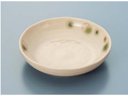
MS-766 EMOR(織部) 深皿 AB 160 × 39 ・ 400ml ¥1,520 P-203 ¥400 → P.303