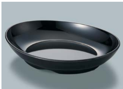
MS-848 BK(黒) オーバル皿 AB