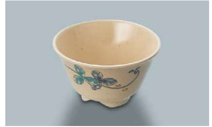
MC-13 MDS(水無月草) 湯呑 AB 97 × 55 ・ 200ml ¥640