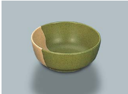
MB-647 WM(技) 丸小鉢 110 × 45 ・ 270ml ¥550