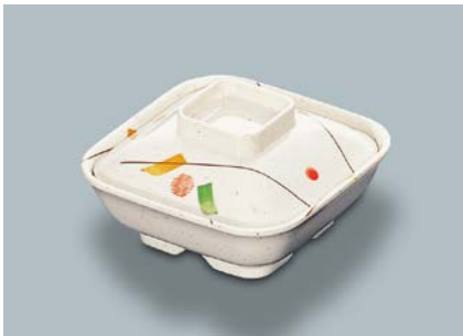
MB-628 SER (セリーン) 角煮物椀蓋