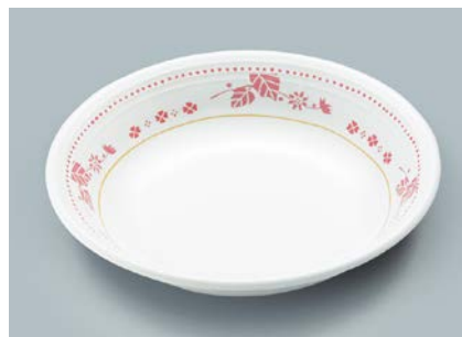
MS-566 SCR(スカーレット) クープ皿 A