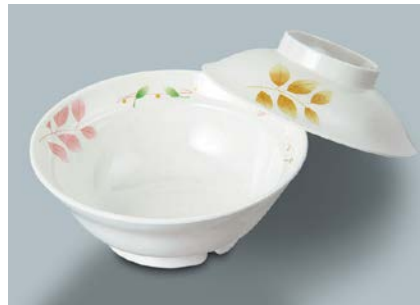
MB-607 HNE(葉音) 煮物椀蓋