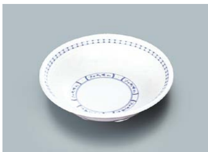
MS-564 BOD(ボルドー) ベリー皿 140 × 35 ・ 280ml ¥760 ☞ C-140 ¥340 → P.303