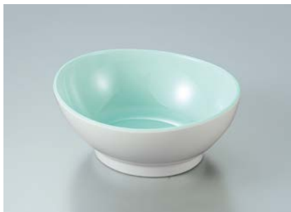
MB-630 MMD(マーメイド)リップボール AB 110 × 95 × 45 ・ 165ml ¥890