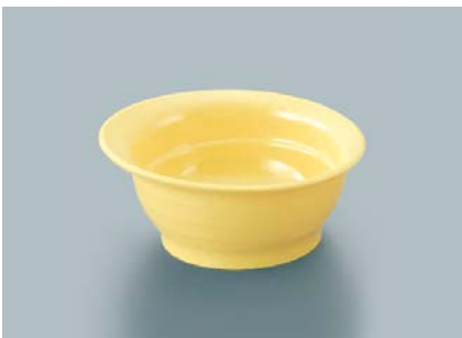
UMB-478 NAN(菜の花)傾斜丸小鉢 105 × 49 ・ 140ml ¥620 POINT すべり止め加工付もあります。(→P.255)