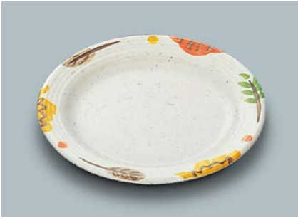
MS-526 CAR(カリブ) パン皿 169 × 17 ¥860