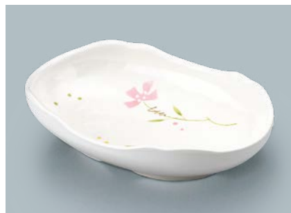
UMS-430 SHIO(しおり) 楕円皿