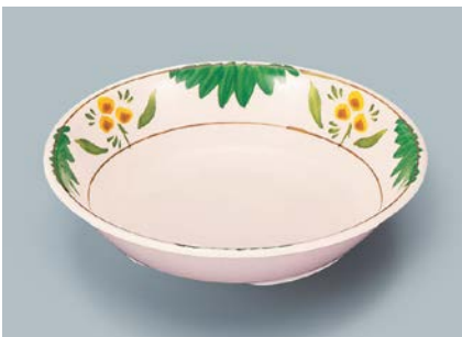
MS-2120 DL (デル・レッタ) カレー皿 198 × 43 ・ 720ml ¥1,180 ☎ C-200 ¥470 → P.302