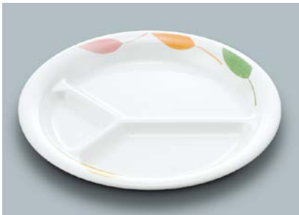
MS-541 HNE(葉音) ミツ仕切皿 A