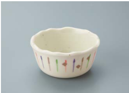
MB-621 ISN (いさ野) 丸小鉢 91 × 43 ・ 140ml ¥660