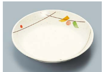
MS-664 SER(セリーン) 菜皿 AB 180 × 30 ¥840 C-180 ¥430 → P.302