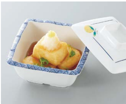
使用食器 | MB-337 F・MB-336 F 角小鉢