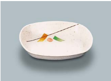
MB-637 SER (セリーン)小判小鉢 AB 133 × 100 × 31 ・ 180ml ¥790 C-1411 ¥400 → P.307