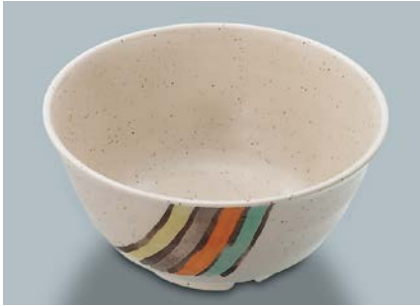
MB-605 FA (ふる里) うどん鉢 AB 180 × 85 ・ 1,170ml ¥1,720 C-180 ¥430 → P.302 UDFU ¥400 → P.308