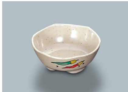
MB-676 FA(ふる里) 小付 AB 84 × 34 ・ 90ml ¥500