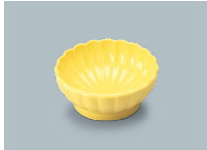
UMB-476 NAN(菜の花) 菊花小鉢 85 × 35 ・ 90ml ¥570