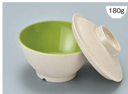
MB-897 CS(クリームストーン) ライスボール蓋 128 × 36 ¥650