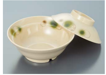
MB-607 EMOR(織部) 煮物椀蓋