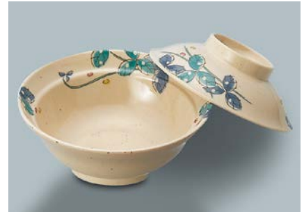
MB-607 MDS(水無月草) 煮物椀蓋

MB-673 EMOR(織部) 煮物椀 AB 135 × 52 75・360ml ¥1,060