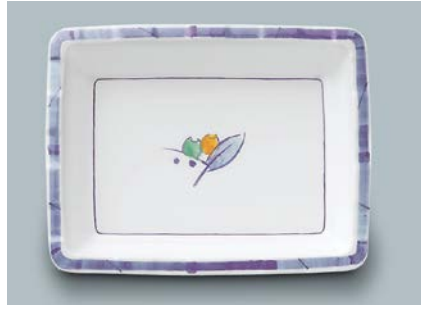
MS-347 NAM (夏目) 角皿 175 × 135 × 27 ・ 300ml ¥1,150