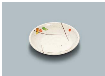
MS-648 SER(セリーン) 和皿 100 × 19 ¥550