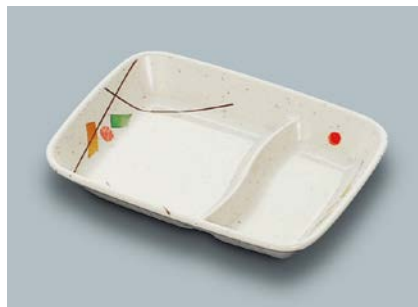
MS-875 SER (セリーン) ニツ仕切角皿 155 × 117 × 26 ¥1,010