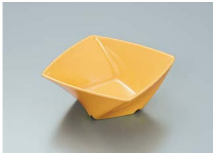
MB-680 MO(メロンオレンジ) ツイストボール A 110 × 110 × 45 ・ 230ml ¥710