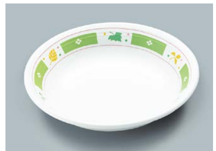
MS-566 GG(グリーンガラス) クープ皿 A