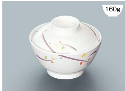
160g MB-609 LNA(ルナデコール) 飯椀蓋 111 × 35 ¥570 MB-608 LNA(ルナデコール) 飯椀 AB 120 × 64 ① 92・400ml ¥920