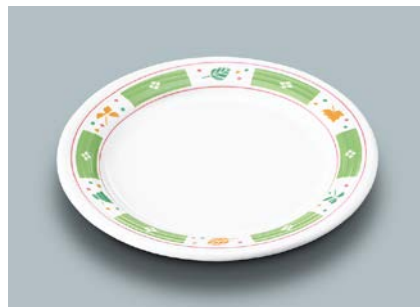
MS-526 GG(グリーンガラス) パン皿 169 × 17 ¥860 C-170 ¥430 → P.302