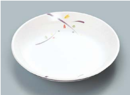
MS-664 LNA(ルナデコール) 菜皿 AB 180 × 30 ¥840 C-180 ¥430 → P.302