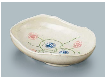
UMS-430 XU(石焼絵付) 楕円皿