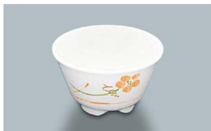
MC-13 YUK(友花) 湯呑 AB 97 × 55 ・ 200ml ¥560