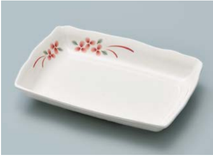
MS-956 AEK (赤絵小花) 角皿 AB 170 × 122 × 28 ・ 270ml ¥1,240 C-1712 ¥450 → P.305