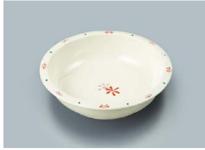
MS-341 HKK(花こころ) 丸深皿 A 140 × 36 ・ 260ml ¥1,000 C-140 ¥340 → P.303