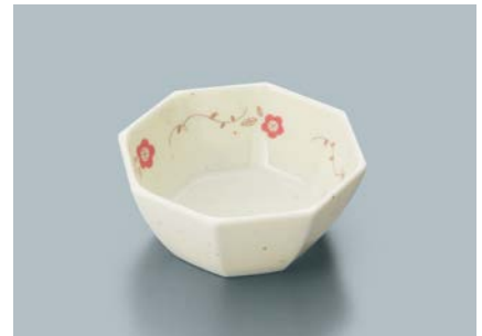
MB-688 HKZ (ひめかずら) 八角小鉢 A 89 × 89 × 40 ・ 130ml ¥820