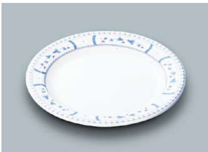
MS-526 BOD(ボルドー) パン皿 169 × 17 ¥860 C-170 ¥430 → P.302