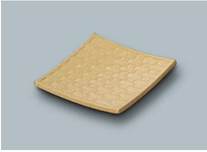
M-104 CX(ふる里) 平角皿 A 109 × 109 × 15 ¥690