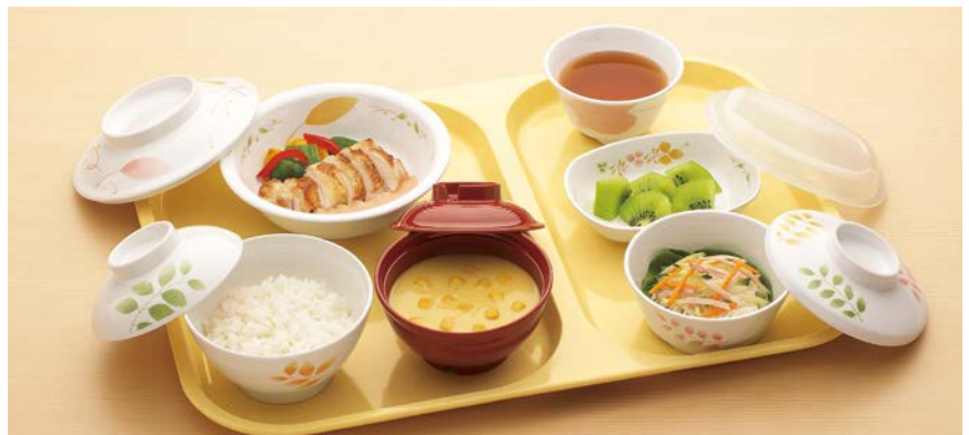
使用食器 MB-609 HNE ・ MB-608 HNE 飯椀、UMF-403 TUS ・ UMB-402 TUS 安定型汁椀、 MB-516 HNE ・ MB-515 HNE 丸鉢、MB-51 HNE ・ MB-50 HNE 小鉢、 C-1411 W、MB-637 HNE 小判小鉢、MC-13 HNE 湯呑