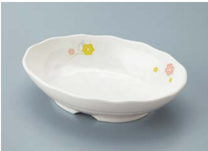
MS-560 KAK (かくれんぼ) 小判皿 AB 170 × 123 × 40 ・ 350ml ¥1,370 P-209 ¥450 → P.307