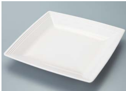
MS-840 SW(白雪) スクエアプレート AB