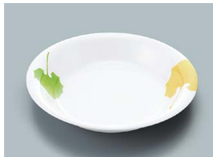
MS-536 HNE(葉音) 菜皿 180 × 168 × 30 ¥950 C-180 ¥430 → P.302