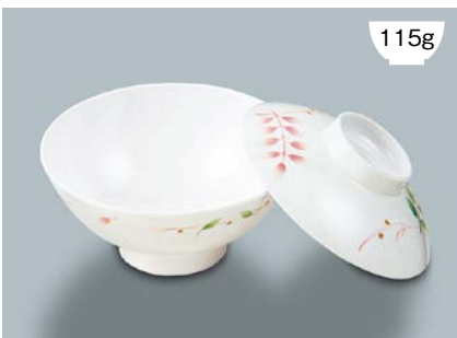
115g MB-804 HNE(葉音) 飯茶椀蓋 107 × 30 ¥620