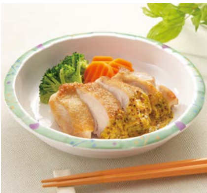
使用食器 | MS-345 F 丸深皿