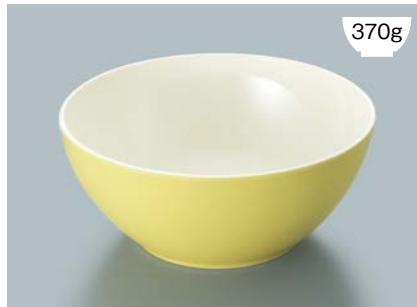
MB-826 LYUW(ライムイエロー内白)フリーボール AB