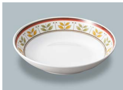
新 MS-248 CRM (カルメラ) 深皿 AB 198 × 43 ・ 780ml ¥1,350 C-200 ¥470 → P.302

使用食器 | MS-150 CRM パン皿、MS-248 CMM 深皿、PC-80 DPM コップ、TAS-01 デザートスプーン、TAS-02 デザートフォーク