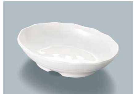
MS-560 W (ホワイト) 小判皿 AB 170 × 123 × 40 ・ 350ml ¥1,090 P-209 ¥450 → P.307