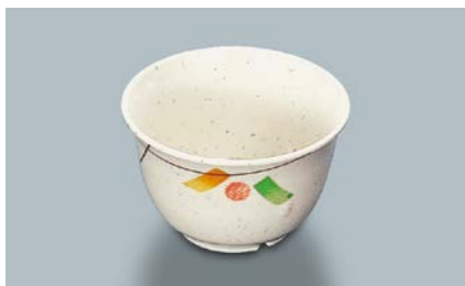
MC-12 SER(セリン) 湯呑 95 × 58 ・ 220ml ¥550