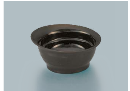
UMB-478 KMT(黒マット)傾斜丸小鉢 105 × 49 ・ 140ml ¥620 POINT すべり止め加工付もあります。(→P.255)