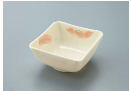
MB-686 FB(ふる里)四角小鉢 AB 89 × 89 × 44 ・ 180ml ¥850 C-1010 ¥320 → P.306