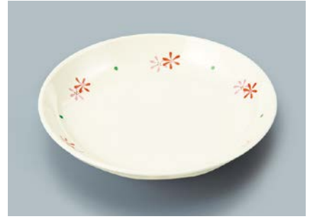
MS-664 HKK(花ころ) 菜皿 AB 180 × 30 ¥900 C-180 ¥430 → P.302