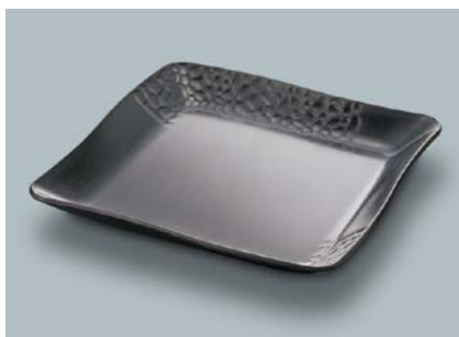
MS-830 KMT(黒マット) 角皿 AB