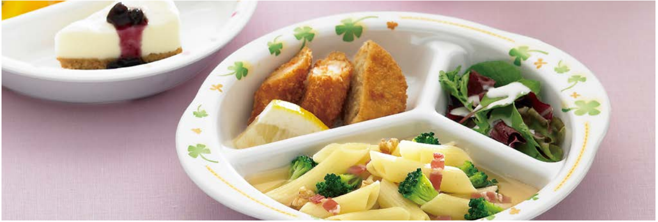
使用食器 | MS-879 HPY ミツ仕切皿