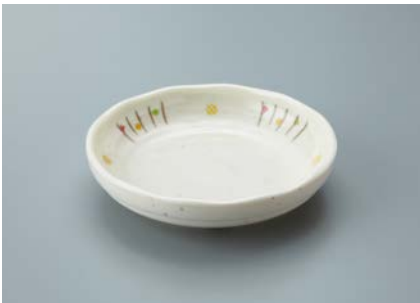
MS-763 ISN(いさ野) 取り皿 AB 130 × 30 ・ 210ml ¥1,070 P-206 ¥380 → P.303