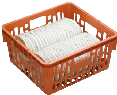
PSK-310N の使用例 メラミンウェア 丸深皿 (MS-343 HNE) × 40 枚 → 334 PAGE ※ MS-343 HNE は、P.139 をご覧ください。