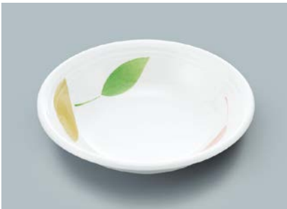
MS-565 HNE(葉音) ケーブ皿 A 165 × 40 ・ 420ml ¥880

☞ C-170 ¥430 → P.302 ☞ P-203 ¥400 → P.303