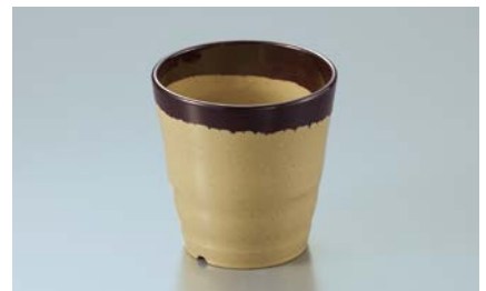
MC-88 SAB(さび) 湯呑 77 × 78 ・ 220ml ¥900 P-204 ¥330 → P.304 PPF-507 ¥310 → P.308