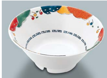
MB-705 BAN (万里) タンメン鉢 AB 195 × 77 ・ 1,000ml ¥1,520 C-200 ¥470 → P.302