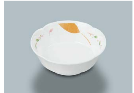
MB-620 HNE(葉音)丸小鉢 AB 110×40・180ml ¥850 C-110 ¥330→P.303