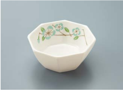
MB-688 FA (ふる里) 八角小鉢 A 89 × 89 × 40 ・ 130ml ¥820