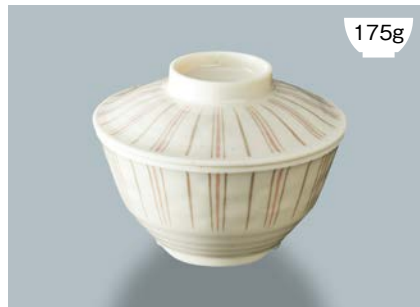
175g 新 MB-973 TKU (十草) 飯椀蓋

新 MB-972 NTK (南天唐草) 飯椀 AB 124 × 65 ① 94 · 410ml ¥1,050