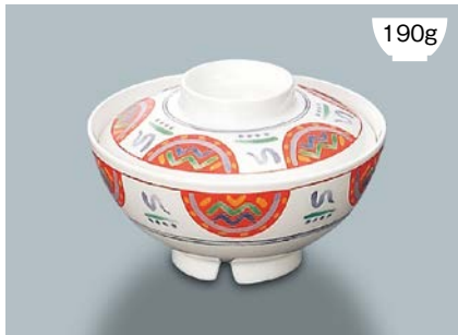
190g MB-577 F (ふる里) 飯椀蓋

MB-576 NAM (夏目) 飯椀 AB 134 × 66 ① 87 · 470ml ¥970