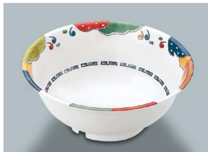
MB-701 BAN(万里) ラーメン丼 AB 203 × 78 ・ 1,350ml ¥1,610