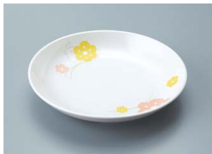
▲ MS-662 KAK(かくれんぼ) 菜皿 AB