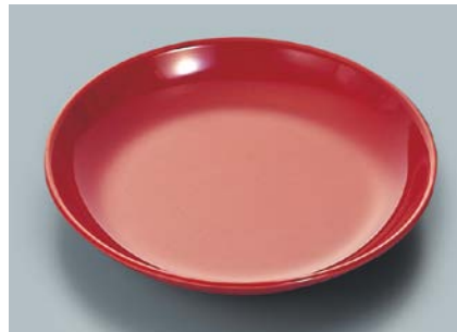
MS-665 R(赤) 菜皿 AB 190 × 30 ¥750 C-190 ¥440 → P.302