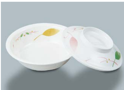
MB-516 HNE (葉音) 丸鉢蓋