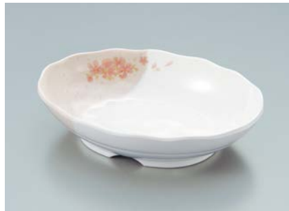
MS-560 EMSK (桜) 小判皿 AB 170 × 123 × 40 ・ 350ml ¥1,440 P-209 ¥450 → P.307