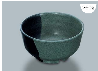
MB-507 LNA(ルナデコール)飯椀 AB 140 × 72 📏 96 ・ 600ml ¥1,020