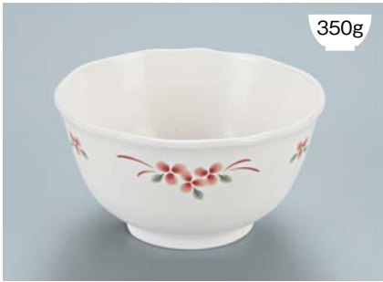
MB-942 AEK (赤絵小花) 丼 AB 150 × 80 ・ 780ml ¥1,360 P-202 ¥380 → P.303 P-207 ¥420 → P.303