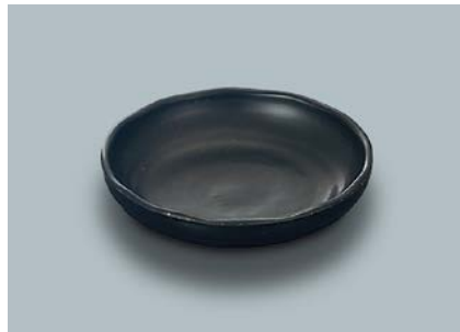
MS-763 KMT(黒マット) 取り皿 AB 130 × 30 ・ 210ml ¥570 P-206 ¥380 → P.303