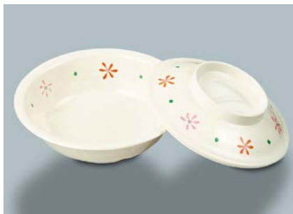
MB-516 HKK (花ころ) 丸鉢蓋