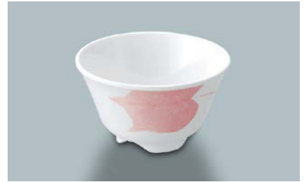
MC-13 HNE(葉音) 湯呑 AB 97 × 55 ・ 200ml ¥610