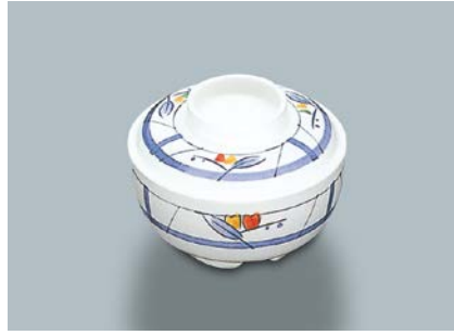
MB-375 NAM (夏目) 丸小鉢蓋 102 × 28 ¥740