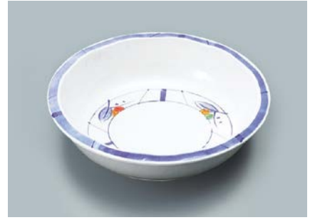
MS-343 NAM(夏目) 丸深皿 A 165 × 40 ・ 430ml ¥1,100

☞ C-170 ¥430 → P.302 ☞ P-203 ¥400 → P.303