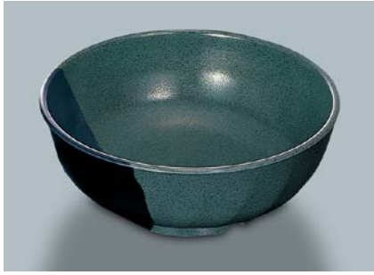
MB-599 WF(技) 麵鉢 AB 200 × 77 ・ 1,400ml ¥1,600 C-200 ¥470 → P.302