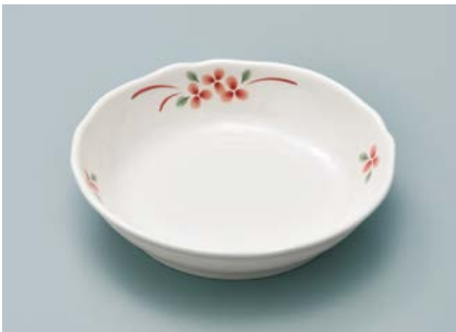
MS-950 AEK(赤絵小花) 深皿 AB 154 × 36 ・ 350ml ¥1,230 P-207 ¥420 → P.303