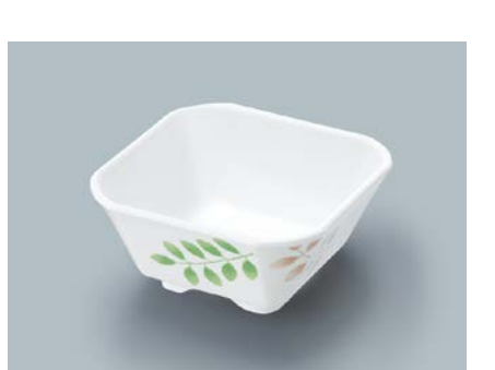
MB-611 HNE(葉音)角小鉢 AB