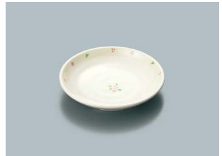
▲MS-648 HMR(華かんむり)和皿 100 × 19 ¥630