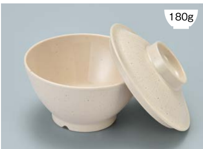
MB-897 CS(クリームストーン) ライスボール蓋 128 × 36 ¥650