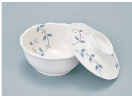
MB-923 NTK(南天唐草)小鉢蓋 104 × 29 ¥710

MB-922 AEK(赤絵小花)小鉢 AB 100 × 40 ①63 ・ 160ml ¥890