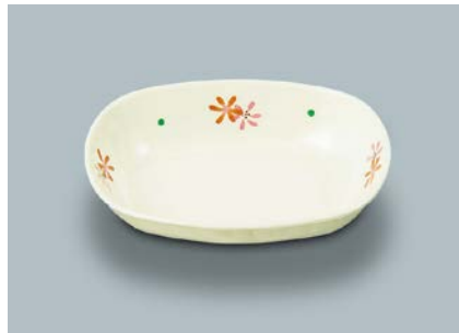
MB-637 HKK (花こころ)小判小鉢 AB 133 × 100 × 31 ・ 180ml ¥830 C-1411 ¥400 → P.307