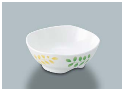
MB-617 HNE(葉音) 小鉢 125 × 46 ・ 270ml ¥970