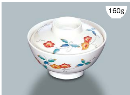
160g MB-575 F (ふる里) 飯椀蓋

MB-574 NAM (夏目) 飯椀 AB 126 × 63 ① 86 · 400ml ¥900