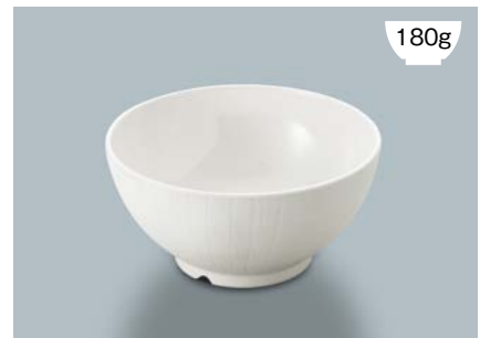
MB-894 W(ホワイト) ライスボール(レギュラー) AB 124 × 61 ・ 400ml ¥930