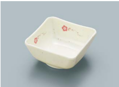
MB-686 HKZ(ひめかざら)四角小鉢 AB 89 × 89 × 44 ・ 180ml ¥850 C-1010 ¥320 → P.306