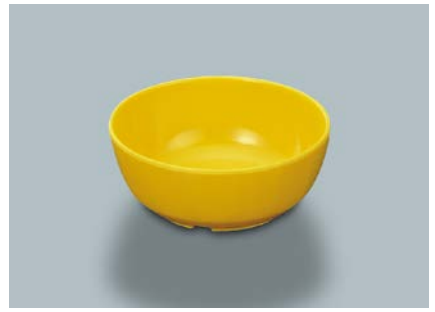
MB-647 Y(イエロー) 丸小鉢 110 × 45 ・ 270ml ¥560