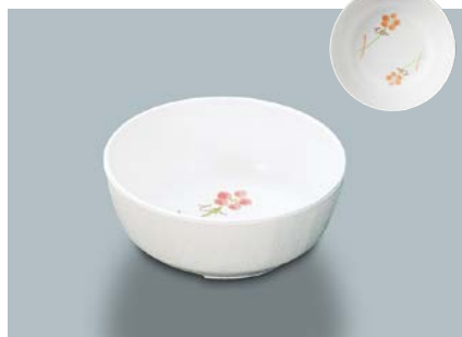
MB-647 YUK(友花) 丸小鉢 110 × 45 ・ 270ml ¥680 ☞ C-110 ¥330 → P.303