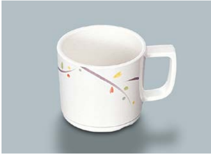
MC-18 LNA(ルナデコール) マグカップ 107 × 80 × 70・250ml ¥940 ① P-204 ¥330 → P.304