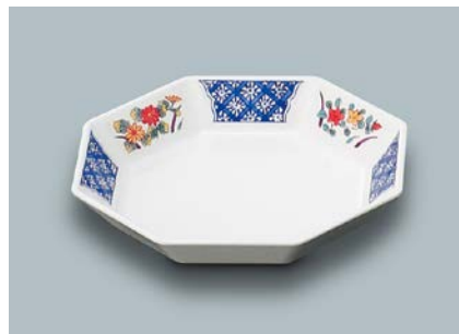
M-101 FYA(ふる里) 八角皿 A 160 × 160 × 30 ¥1,140