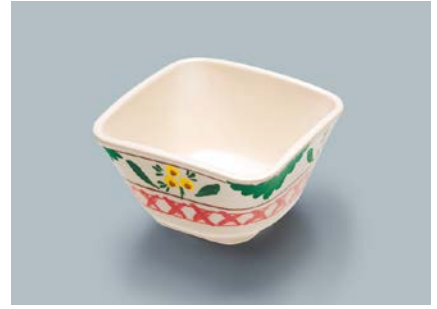
MB-610 DL (デル・レッタ)角小鉢 AB 91 × 91 × 50 ・ 190ml ¥750