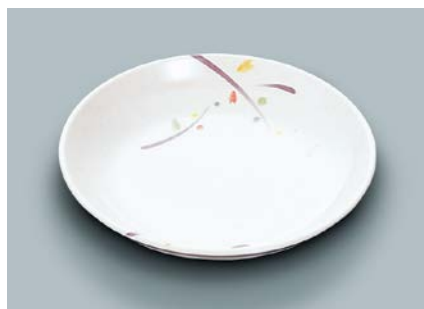
MS-662 LNA(ルナデコール) 菜皿 AB