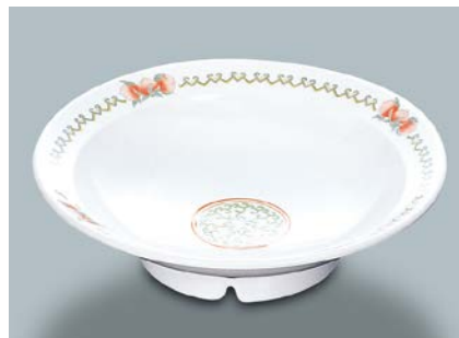
MS-715 CN(中華) 高台鉢 AB 214 × 56 ¥1,550