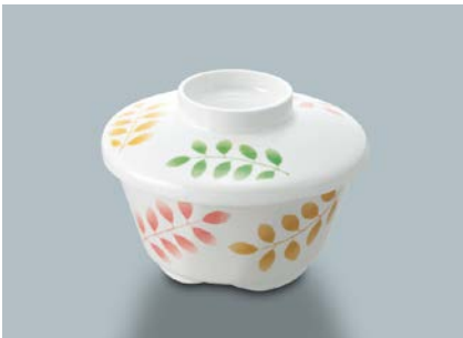
MB-51 HNE(葉音) 深小鉢蓋