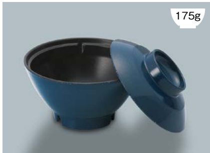
175g MB-903 AD (青ダイヤ) 飯椀蓋

MB-902 FC (ふる里) 飯椀 AB 126 × 67 ① 94 · 410ml ¥1,130