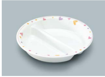
MS-874 HRT (ハート) ニツ仕切皿 176 × 34 ¥1,420