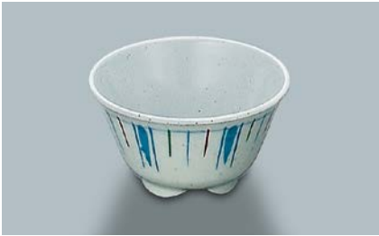
MC-13 F(ふる里) 湯呑 AB 97 × 55 ・ 200ml ¥530