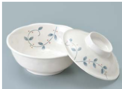
MB-963 NTK(南天唐草) 煮物椀蓋 120 × 32 ¥900