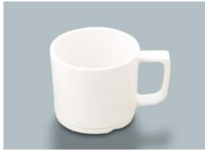
MC-18 W(ホワイト) マグカップ 107 × 80 × 70・250ml ¥740 ① P-204 ¥330 → P.304