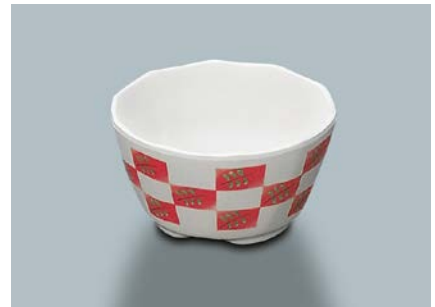
MB-618 FB(ふる里) 深小鉢