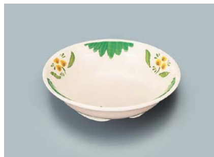
MS-564 DL(デル・レッタ) ベリー皿 140 × 35 ・ 280ml ¥790 ☞ C-140 ¥340 → P.303