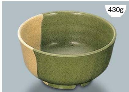
MB-595 WM (技) 多用丼 AB 160 × 82 ・ 950ml ¥1,120 P-203 ¥400 → P.303 C-160 ¥460 → P.303 71M ¥950 → P.308