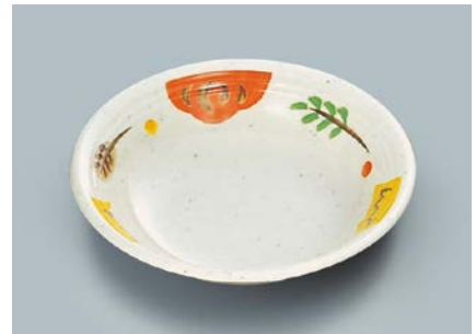
MS-565 CAR(カリブ) ケーブ皿 A 165 × 40 ・ 420ml ¥900

☞ C-170 ¥430 → P.302 ☞ P-203 ¥400 → P.303