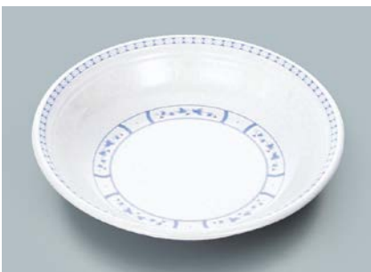
MS-566 BOD(ボルドー) クープ皿 A