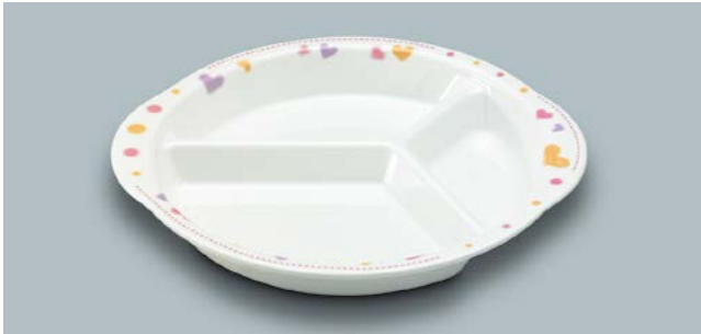
MS-878 HRT(ハート) ミツ仕切皿