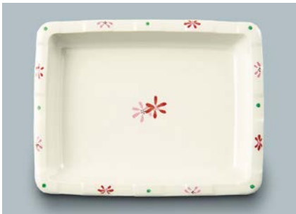
MS-347 HKK (花ころも) 角皿 175 × 135 × 27 ・ 300ml ¥1,190