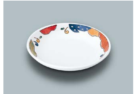
MS-661 BAN(万里) 菜皿 AB 140 × 26 ¥790 C-140 ¥340 → P.303