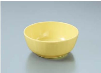
MB-647 LMY(ライムイエロー) 丸小鉢 110 × 45 ・ 270ml ¥560