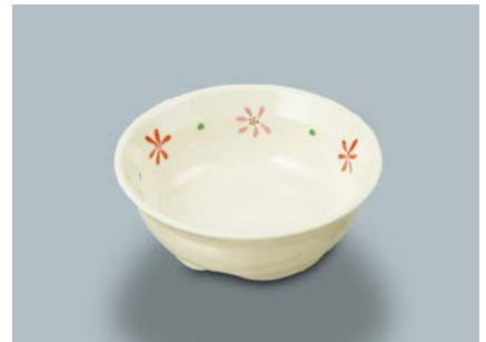
MB-632 HKK(花ころ)小鉢 105 × 37 ・ 160ml ¥740 C-106 ¥330 → P.304