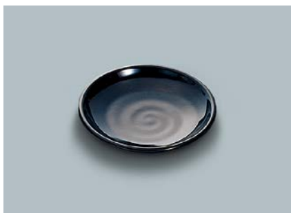
MS-648 BK(黒) 和皿 100 × 19 ¥340