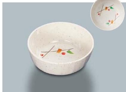
MB-647 SER(セリン) 丸小鉢 110 × 45 ・ 270ml ¥650 ☞ C-110 ¥330 → P.303