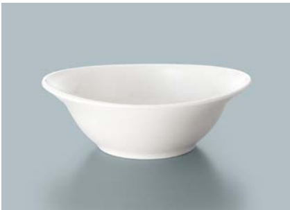
MB-816 W(ホワイト) マルチボール AB 165 × 137 × 55 ・ 410ml ¥1,270