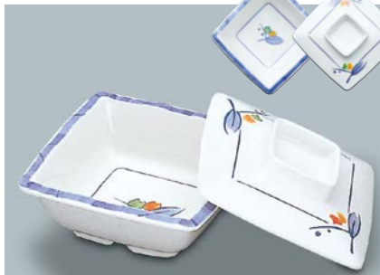
MB-339 NAM(夏目) 角小鉢蓋 104 × 104 × 27 ¥780

MB-338 NAM(夏目) 角小鉢 A 110 × 110 × 40 ①64・220ml ¥930