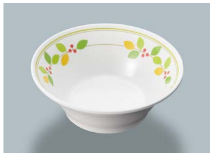
新 MB-180 NNA(ニーナ) サラダボール AB 130 × 46 ・ 280ml ¥970 ☞ P-206 ¥380 → P.303