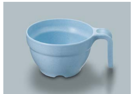
MC-80 SOR (空) スープカップ AB