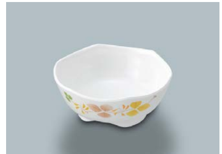
MB-676 HNE(葉音) 小付 AB 84 × 34 ・ 90ml ¥560