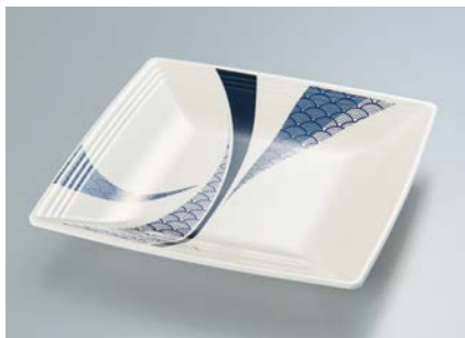
MS-838 EMSG(青海波) スクエアプレート A 160 × 160 × 24 ¥1,180