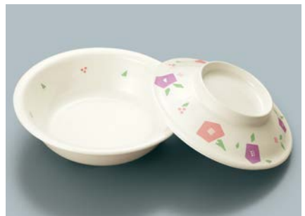
MB-516 HMR (華かんむり) 丸鉢蓋