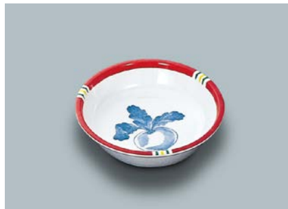
MS-532 F(ふる里) 深小皿 105 × 25 ・ 130ml ¥570 C-106 ¥330 → P.304