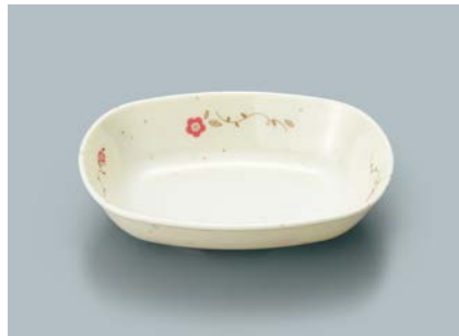
MB-637 HKZ (ひめかずら)小判小鉢 AB 133 × 100 × 31 ・ 180ml ¥810 C-1411 ¥400 → P.307