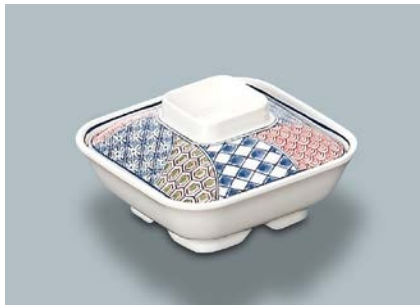
MB-628 F (ふる里) 角煮物椀蓋